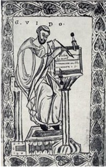
Görsel 1 Guido Arrezzo

Bu yöntem müzik tarihinde Guido'nun Eli olarak anılır.