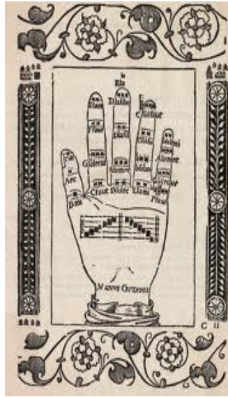
Görsel 1 Guido Arrezzo'nun eli