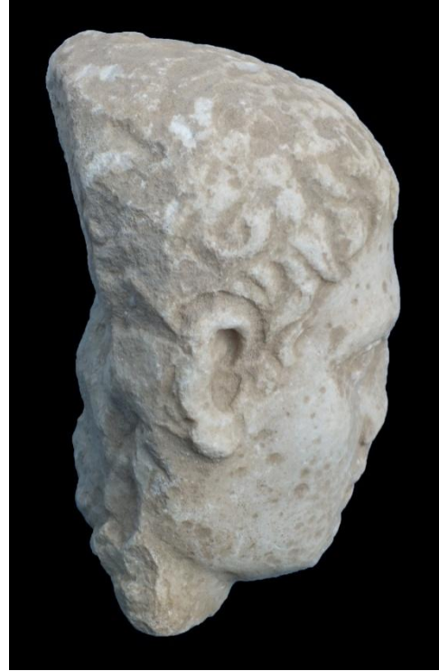
Levha I. Özel Portre/Iulius - Claudiuslar Dönemi (Res.: Y. ARLI, 2018).