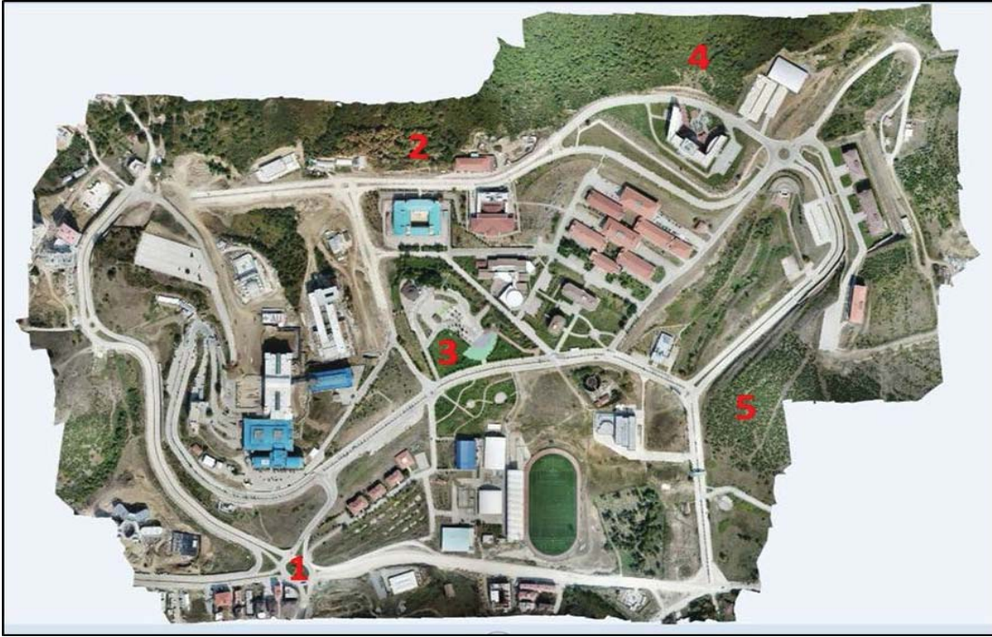
Şekil 1. Düzce Üniversitesi Konuralp Yerleşkesi gözlem noktaları

Arazi çalışmaları 2017-2018 yıllarında gerçekleştirilmiştir. Gözlemler her ay, haftada iki gün sabah (07.00-10.00) ve akşam (16.00-17.30) olmak üzere günde iki sefer gerçekleştirilmiştir. Kuş gözlemleri için nokta gözlem ve hat boyu (transekt) gözlem yöntemleri kullanılmıştır. Hat boyu gözlemlerde Orman Fakültesi önünden başlayarak kampüste tam bir tur yapılmış ve görülen türler kaydedilmiştir. Nokta gözlemlerde ise kampüs alanında beş nokta belirlenerek her bir noktada bir gözlem gününde 20 dakikalık gözlemler yapılmıştır (Şekil 1 ve Çizelge 1). Kuş gözlemleri süresince alanda belirlenen diğer omurgalı türleri de kaydedilmiştir. Çalışmada Nikon Action Ex (8X40) marka dürbün kullanılmıştır.