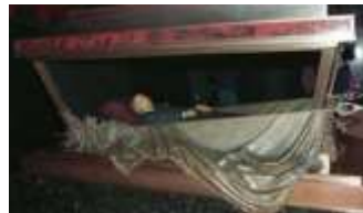
Görsel 16. Kızıl Meydan'da yer alan Lenin Mozolesi , Moskova-Rusya.

Sırtüstü yatan heykelin bu okumasının yanında, Lenin heykelinin yeni pozisyonu ile Kızıl Meydan'daki Lenin'in mozolesi ikonolojik açıdan benzerlik göstermektedir. Sven Dalsgaard'ın kompoze edişiyle tekrar kamusal alanda boy gösteren heykeldeki yatay Lenin; devrilmeyi, ölümü, sonsuz uykuyu ve bir sonu anlatır. Kızıl meydandaki mumyalanmış bedeni ile benzer şekilde levhalar üzerinde sırt üstü yatırılmış Lenin temsili arasında algısal bir bağ kurulabilir.