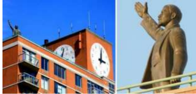
Görsel 2. Yuri Gerasimov, Lenin , 1990, Bronz, Red Square Apartmanı çatısı, Amerika.

Çalışmanın temelini oluşturan Lenin Died heykeli yukarıda bahsi geçen sıradan vandallık hareketlerinden veya yüzeysel artistik müdahalelerden farklı olarak biçimsel bir bozulma-eksiltme gerçekleşmeksizin yeniden üretimle tekrar varlık bulmuştur. Diğer girişimler ya eski etkisini azaltmaya yetemeyen zayıf kitsch müdahaleler boyutunda kalmış ya da mekân değişimleri yapılmış olsa da kamusal bir süreklilik arz eden tarife ulaşamamıştır (Görsel 2,3,4,5,6,7,8).