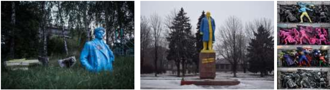
Görsel 3. Hurdalığa terk edilmiş ve Boya ile Müdahale edilmiş Lenin Heykeli, Ukrayna.