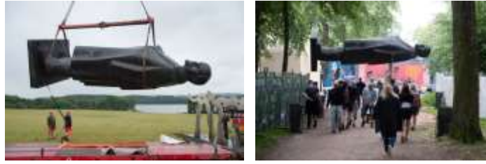
Görsel 14. Smukfest Festival Alanına 'Aşk' kampına taşınan Lenin Died Heykeli .

Yaratılmış ironi, belirli bir fikri veya hissi dil ile ifade etmek yerine, Lenin'i bağlamından kopararak dekoratifleştirmiş, yine artistik bir kod ile uluslararası bir ifade açığa çıkarılmıştır. Şehirde geleneksel olarak düzenlenen festivallerde (Smukfest) teşhir amaçlı geçici olarak taşınmasıyla hem yeni dikte edilmiş hali hem de dekoratif nesnelliği vurgulanmaktadır (Soren, 2017). Dekoratif olan, bir şeye hizmet eder ve kaldırıldığında ya da yeri değiştirildiğinde enflasyonik kimliğini de tekrar varlık bulmak üzere yeni yerine taşımaktadır (Görsel 14,15).