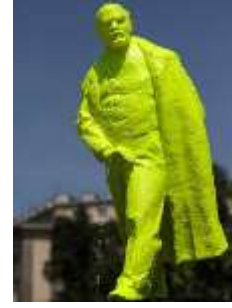
Görsel 6. Boya ile müdahale edilmiş ve plastik eklentiler yapılmış Lenin Anıtı, Ukrayna.