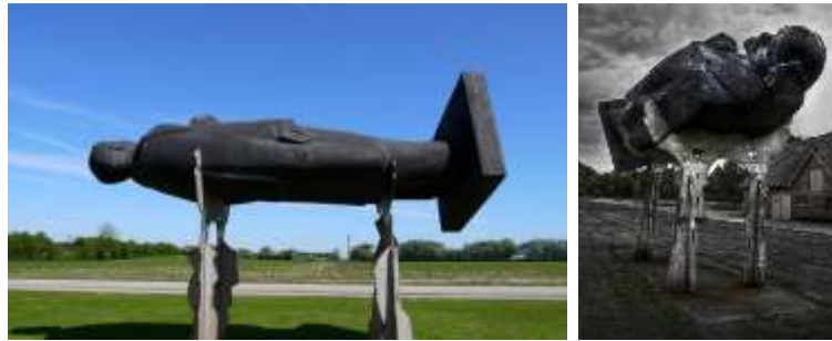
Görsel 11. Lenin Died (Lenin Er Dod) , Farklı Açılardan Görüntü.