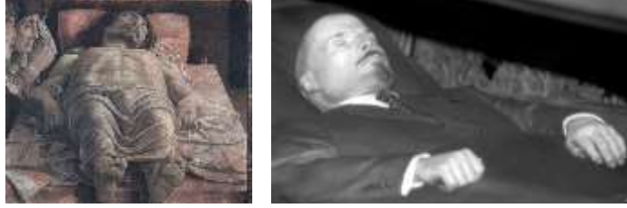
Görsel 17. Andrea Mantegna (1431-1506), Ölü İsa'ya Ağıt (Lamentation Over The Dead Christ) , 1480, Tuval üzerine tempera, Pinacoteca di Brera, Milan.