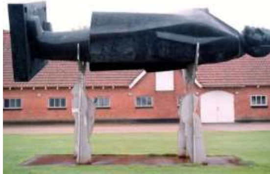
Görsel 10. Sven Dalsgaard, Lenin Died (Lenin Er Dod) , 2000, Bronz-paslanmaz çelik, 10x4 m, A Hereford Beefstouw, Danimarka.

Sven' in heykel teşhirini kurgularken ki tavrı incelendiğinde, sipariş edilmiş olmasına rağmen kendi üretim dili ve açığa çıkan çalışmadaki genel etkiye olan hâkimiyeti dikkat çekicidir. Sanatçının karşılaşılabileceği işveren taleplerinin karşısındaki artistik tercih bakımından sınırlılık olasılığından uzak özgür/özgün bir ifade tarzı gözlenmektedir. Abne Samlinger, Dalsgaard'ın çalışmayla ilgili tavrını "Dalsgaard, kendi hayatını sanatsal sürecin temeli olarak kullanmış, tüm üretimini samimiyet ve soyutlama arasında bir kutuplaşma olarak görmüştür. Sübjektif ve evrensel insan, yakın ve mesafeli bakış, gerçek ve hayali arasındaki çift bakış ile- diyalektik, aktif bir sanatçı olarak altmış yıl boyunca tüm malzemelerle ifade biçimleri gerçekleştirmiştir" şeklinde açıklamaktadır (Samlinger,2014).