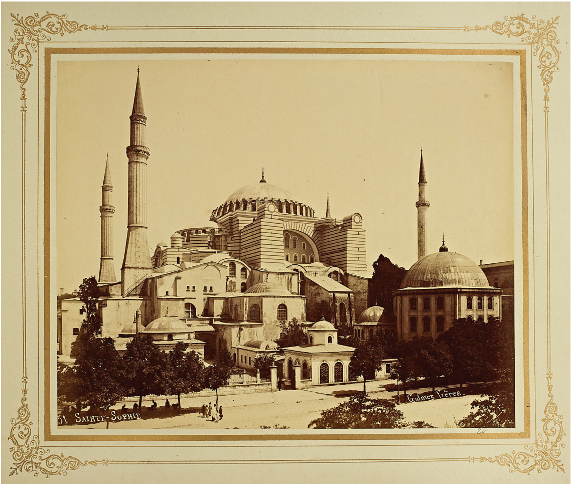
Ayasofya Caminin Görünüşü

Vakfiyede, Osmanlı padişahları içerisinde, ilim ve marifeti, fen ve sanatı himaye etmekle temayüz eden Fatih Sultan Mehmed'in İstanbul özelinde medeniyet tasavvurunu da bütün detayıyla görmekteyiz. Bu sebeptendir ki, Fatihi, fethi, Ayasofyayı, anlamak ve bir modern, yaşanılabilir, manevi bir ruha da sahip İslam şehri nasıl olmalı? Sorusuna cevap verebilmek için Fatih Sultan Mehmed Han'ın vakfiyelerini ve hizmetlerini tam manasıyla öğrenmek ve öğretmek durumundayız.