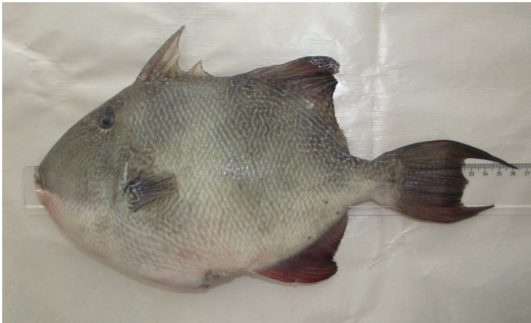
Şekil 2. İbrice Limanı'ndan yakalanan B. capriscus .

(2011a, 2011b); Gelibolu Yarımadası'ndan Cengiz ve ark. (2012) ve Cengiz (2013); Gökçeada'dan Keskin ve Ünsal (1998), Karakulak ve ark. (2006), Altın ve ark. (2015) ve Gönülal (2017); Bozcaada'dan Eryılmaz (2003) ve Edremit Körfezi'nden Torcu ve Aka (2000), Çakır ve ark. (2008) ve Ünlüoğlu ve ark. (2008) bölgelerin tür çeşitliliği hakkında bilgiler vermiş olmalarına rağmen, bu araştırmacıların