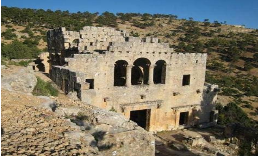
Görsel 2: Mersin Mut Alahan Manastırı Doğu Kilise Genel Görünüşü