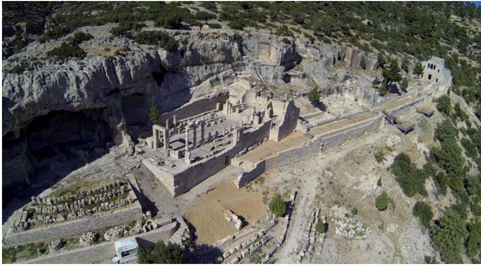
Görsel 1: Alahan Manastırı