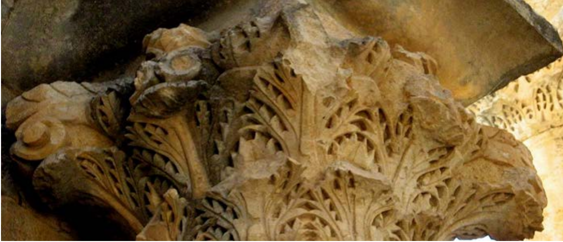
Görsel 3: Alahan Manastırı Mimarisi