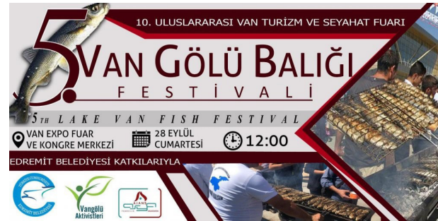
Şekil 9. Afiş, (Van Gölü Balığı) (Anonim 2020e)

Van balığına bilimsel ve kültürel dayanağı olmayan adlandırmaların ısrarla verilmeye çalışılması, Eric Hobsbawn’ın “ Geleneğin İcadı ” isimli eserinde belirttiği gibi “ bilinçli veya bilinçsiz bir şekilde-kültürel hafızayı silmeye ve değiştirmeye yönelik çalışmalar ” olduğu yönünde ciddi endişeler doğurmaktadır.