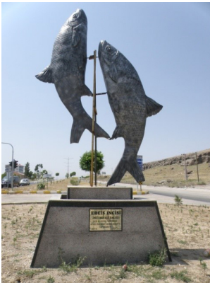
Şekil 7. Erciş İlçesi’nde bulunan balık heykeli (Erciş İncisi)

Diğer yandan Van balığı göçünün izlenmesinde ilk istasyonun Erciş ilçesinde bulunan Deliçay üzerinde kurulması nedeniyle bu balığın sanki sadece Erciş sınırları içinde ürettiği algısı yaratılmaya çalışılmıştır. Oysaki Deliçay, üremek için Van balığının akın ettiği akarsulardan sadece biridir. Bu bağlamda yakın zamanda Muradiye ilçesinde yapılan başka bir balık göçü izleme istasyonu bu tekeli değiştirmiştir, böylece bu göçün sadece Erciş’de olduğu algısı biraz olsun kırılmıştır. Van gölüne dökülen irili ufaklı onlarca akarsuyun tümünde bu göç yaşanmaktadır. Hatta günümüzde kurumuş olan ve Van kent merkezi yerleşim alanları içinde kalan, bahar aylarında eriyen kar suları ile akmaya başlayan Akköprü deresinde, Van Gölü’nden şehir merkezindeki Beşyol mevkiine kadar yaklaşık 11 km boyunca balıkların göç ettiği basına yansımıştır.