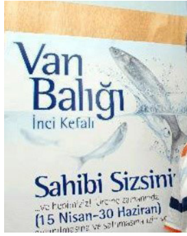
Şekil 5. Afiş (Van Balığı-İnci Kefali)