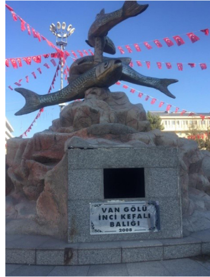
Şekil 8. Van İli’nde bulunan balık heykeli (Van Gölü İnci Kefali Balığı) (Mehmet Murat OTO)