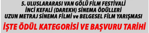
Şekil 3. Film Festivali Afışı (İnci Kefali-Darekh) (Anonim, 2020a)