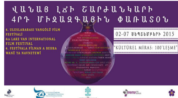
Şekil 4. Film Festivali Afışı (İnci Kefali-Darekh) (Anonim, 2020b)

Sözlü görüşme yapılan ileri yaşlardaki Vanlı bireyler, anne baba ya da dedelerinden dahi darek, tarek ve buna benzer bir adlandırmayı duymadıklarını ifade etmişler; geçmişten bu yana hep Van balığı ismini kullandıklarını belirtmişlerdir. Aynı şekilde ileri yaşlardaki Kürt kökenli Vanlı bireylerle yapılan sözlü görüşmelerde de bu tarz bir isimlendirmenin kullanımını duymadıklarını ve Kürtçe adlandırmada, balık için "masi" ve Van balığı için ise "masiye Van'e" (Van Balığı) ifadesini kullandıklarını ifade etmişlerdir.