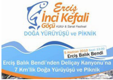
Şekil 6. Afiş (Erciş İnci Kefali) (Anonim, 2020c)

Diğer yandan Van balığı göçünün izlenmesinde ilk istasyonun Erciş ilçesinde bulunan Deliçay üzerinde kurulması nedeniyle bu balığın sanki sadece Erciş sınırları içinde ürettiği algısı yaratılmaya çalışılmıştır. Oysaki Deliçay, üremek için Van balığının akın ettiği akarsulardan sadece biridir. Bu bağlamda yakın zamanda Muradiye ilçesinde yapılan başka bir balık göçü izleme istasyonu bu tekeli değiştirmiştir, böylece bu göçün sadece Erciş’de olduğu algısı biraz olsun kırılmıştır. Van gölüne dökülen irili ufaklı onlarca akarsuyun tümünde bu göç yaşanmaktadır. Hatta günümüzde kurumuş olan ve Van kent merkezi yerleşim alanları içinde kalan, bahar aylarında eriyen kar suları ile akmaya başlayan Akköprü deresinde, Van Gölü’nden şehir merkezindeki Beşyol mevkiine kadar yaklaşık 11 km boyunca balıkların göç ettiği basına yansımıştır.