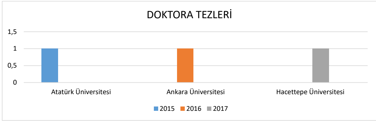
Şekil 2. Doktora tezlerinin sayısal dağılımı grafiği

Şekil 2 incelendiğinde 2003-2020 yılları arasında araştırma konusuna dahil olan 3 adet doktora tezi yazıldığı görülmektedir. Tezlerin her birinin farklı üniversitelerde ve 2015-2017 yılları aralığında çalışıldığı görülmektedir.