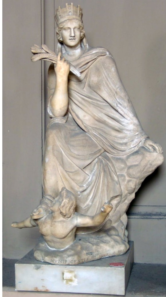
Resim 3. AntiokheiaTykhe'si.

Söz konusu coğrafyada sikke betimlerinden yola çıkarak üç farklı Tykhe tipi olduğu tespit edilmiştir (Kropp 2015: 201). Bu tasvirlerin öncüsü ise İ.Ö. 300 yıllarında heykeltıraş Eutykhides tarafından yapılmış olan Antiokheia Tykhesi'dir. Bu heykelde tanrıça, oturur vaziyette betimlenmiştir. Kule taç ve uzun bir elbise giyen tanrıçanın sağ ayağı, Orestes (Asi) Nehri'nin kişiselleştirilmiş hali olan genç bir erkek figürüne dayanır (Kropp 2015: 202) ( Resim 3-4 ).