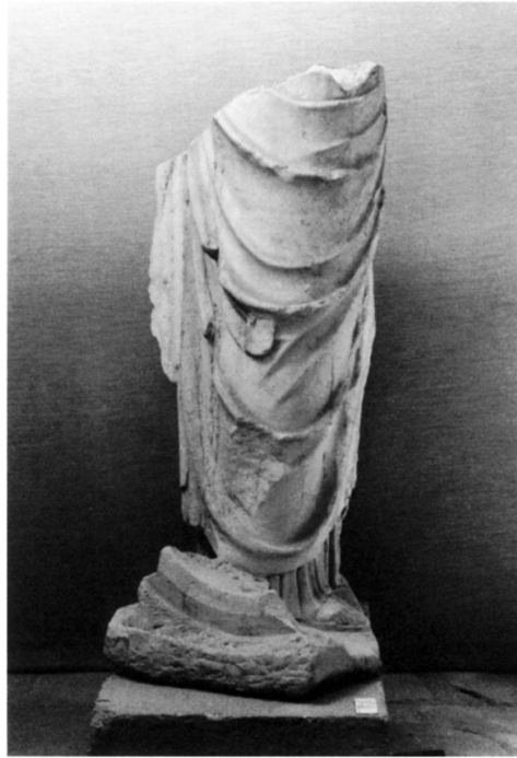
Resim 2. Hyeraptina Tipi Tykhe. Korinth. (Edwards 1990)

"emphasizes that the expansion of the concept of Nemesis from punishing judge to a personification of divine order, natural as well as ethical, is the latest stage of her development, concurrent with the appearance of her celestial associations. Fortune's wheel, a metaphor for the endless changes in human life, the seemingly accidental turns from prosperity to disaster, occurs earlier in literature than Nemesis' wheel."