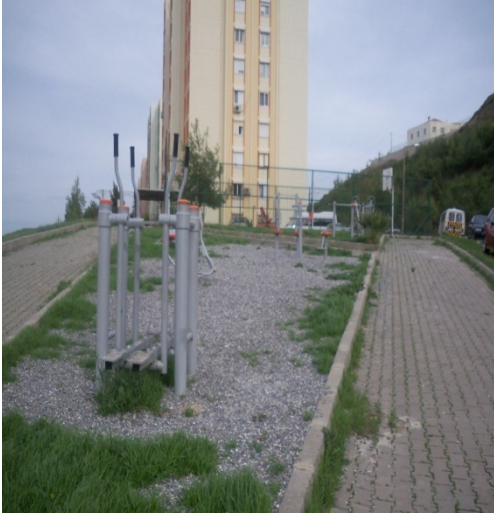
Foto 10: NARBEL bloklarının sonunda bulunan spor aletleri (NARKENT'e en uzak bölge)