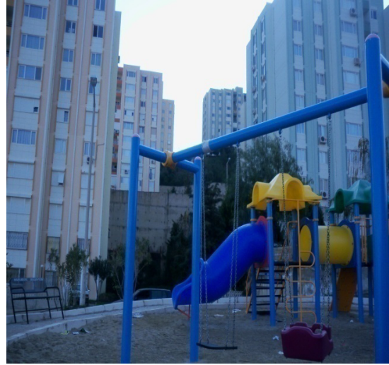
Foto 11: NARBEL bloklarının altında bulunan Kemal Sunal Parkı ve NARBEL blokları

Gecekondu alanı ise mahallenin, tamamı olmasa da önemli bir kısmı gecekondu olan ve muhtemel bir kentsel yenileme sürecine konu olacak kesiminde yaşayanlardan oluşmaktadır.