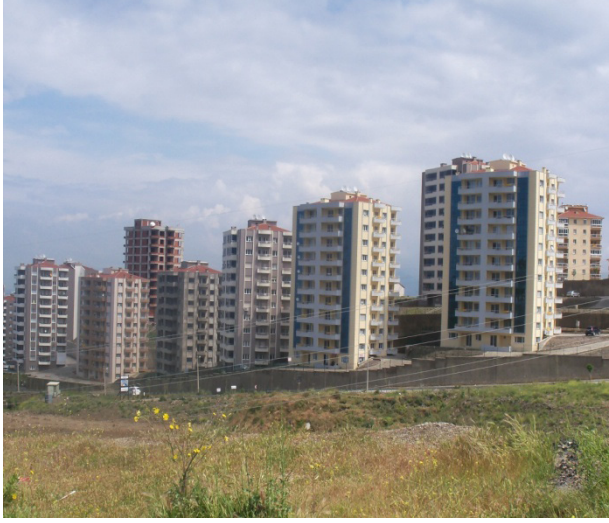
Foto 18: Gecekonduların boşalttığı alana yapılan konutlar (NARKENT tarafından görünüşü)