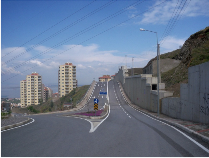
Foto 20: Gecekonduların boşalttığı alana yapılan sitelere giden yol (“İzmir’in En Pahalı Yolu” olarak haber oldu)

Bu öngörünün dayandığı tek veri konutların fiyat farklılıkları değildir. Daha önceden NARKENT ve NARBEL bloklarına gidebilmek için kullanılan tek yol gecekonduların içinden geçmekteydi. Bu da mahalledeki tüm kesimlerin birbiriyle belli ölçüde karşılaşmaları ve etkileşime girmeleri anlamına geliyordu. Ancak “İzmir’in En Pahalı Yolu” olarak gazete sayfalarında haber olan Erdal İnönü Caddesinin inşa edilmesiyle, hiç gecekondu ile alakadar olmadan, hatta hiç gecekondu görmeden İnönü Caddesine inmek mümkün. Böylelikle, zaten kapıları “güvenlik”li, kapalı/kapılı siteler olan bu yeni yapılaşmalar, sadece kendi iç alanlarını değil; aynı zamanda neredeyse caddelerini bile “özelleştirmiş” oldular.