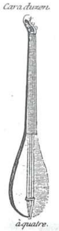
Şekil 6: 18. Yüzyıl (1767 yılı) Karadüzen Sazı, C.H. Blainville; (1711-1769).