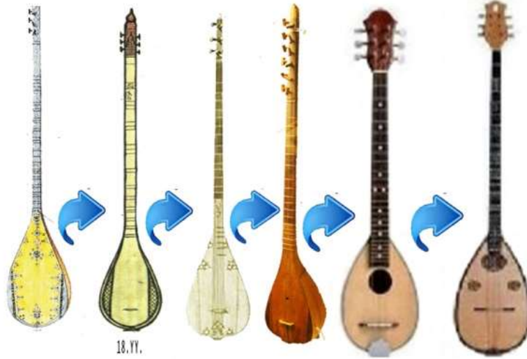
Şekil 7: Bozuk/Büzürg'den tanburaya , uzun kollu tanburadan buzukiye çalgı formları ( Hızır Ağa Edvârı ( TSMK 1793)18.yy. Tanbur Risalesi (ÖNB.389)18. yy. Description Del' Egypte ansiklopedisi, Atina Ulusal Tarih Müzesi 19. yy. Y.Makyinannis tanburası, Eski üç çift telli buzuki çeşitleri.

görebilmek açısından önemlidir. Buzuki'nin en eski çeşidi ve asıl hâli üç telli “Trikordo Buzuki”dir ve akordu re-la-re şeklinde düzenlenmişken, karadüzen akordu denilen çeşidi re-sol-la olarak tertip edilmiştir(Akay, 2015; 5-10).