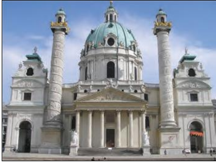
Şekil 3 Avusturya’da minareye benzer kuleleri ile bir yapı