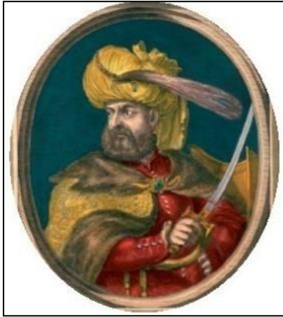
Şekil 9 Kara Mustafa Paşa

“Österreich wird zu einer europäischen Großmacht/Avusturya Avrupa’nın Büyük Bir Gücü Oluyor” başlıklı konuda; Sadrazam Kara Mustafa Paşa’nın 1683’teki savaşta Osmanlı komutanı olduğundan ve savaş kaybedince Sultanın emriyle boğularak öldürüldüğünden bahsedilip, Kara Mustafa Paşa ile İmparatorluk ordusunun Kahlenberg yamacından Osmanlı askerlerine saldırılarının resimlerine yer verilmiştir (Scheucher ve diğerleri, 2013: 135).