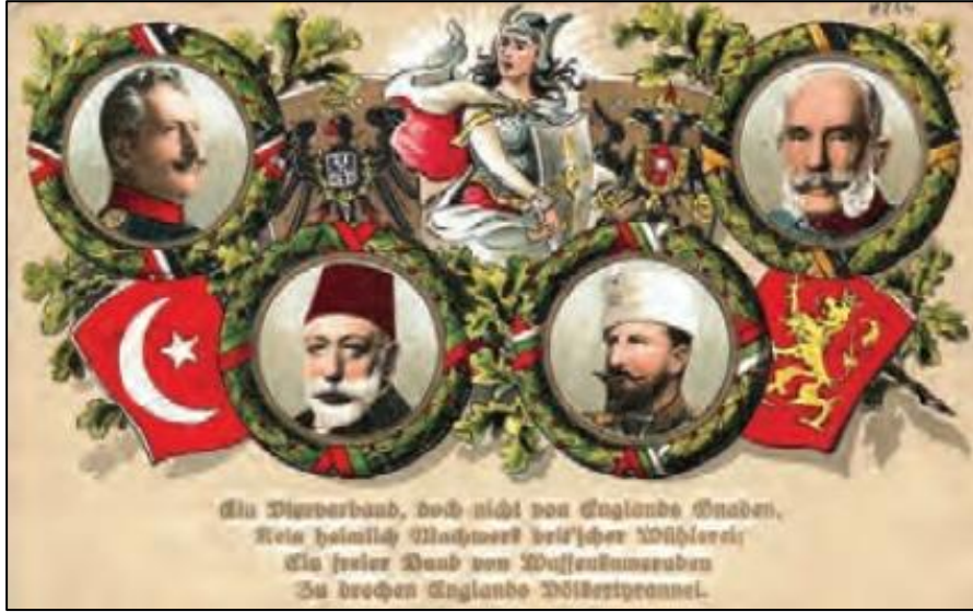
Şekil 6 İttifak Devletleri hükümdarlarını gösteren kartpostal

28 Haziran 1914 tarihinde Franz Ferdinand'ın Saraybosna'da bir Sırp milliyetçisi olan Princip tarafından öldürülmesinin ise barut fıçısına dönen Avrupa'da savaşı başlatan kıvılcım olduğu, Avusturya-Macaristan İmparatorluğu'nun katillerin Sırbistan tarafından korunduğunu ileri sürerek bu devlete savaş açtığı ve iki devlet arasında başlayan bu savaşın İtilaf ve İttifak devletlerinin de birbirlerine savaş ilan etmeleriyle kısa sürede bir dünya savaşına dönüştüğü belirtilmiştir (Evirgen, 2016: 166).