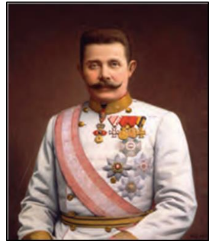
Şekil 5 Avusturya-Macaristan İmparatorluğu Veliahdı Franz Ferdinand