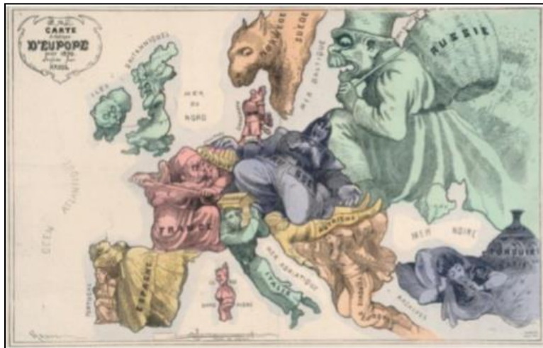
Şekil 11 1914'te basılan bir kartpostal

"Fremdsein in Österreich/Avusturya'da Yabancı Olmak" başlıklı konuda; Avusturya'da tanınan altı etnik gruptan insanların yaşadıklarından, bunlara tanınan haklardan ve bu hakların uygulanmasında siyasi açıdan kimi sorunların yaşanabildiğinden bahsedilmiştir. Avusturya ekonomisinin toparlanma sürecinde konuk çalışanlar olarak özellikle Türkiye'den ve eski Yugoslavya'dan insanlar geldiği ve konuk çalışanların ailelerinin de onları takip ettiği, konuk çalışanların orada çalışan, yaşayan ve vergi veren göçmenler oldukları, bunların çocukları veya torunları her ne kadar Avusturya'da doğup büyüseler de bazen yabancı olduklarının düşünüldüğü ifade edilmiştir (Ebenhoch ve diğerleri, 2014: 148). 1956'da Macaristan'dan yaklaşık 200.000 kişinin kaçtığı ve bu durumda büyük bir yardımseverlik gösterildiği, o zamandan beri mültecilerin, ülkelerinde ölüm veya hapis cezasına çarptırılanların, Irak'tan veya Türkiye'den Kürtlerin, Afrika ya da Uzak Doğu ülkelerinden insanların Avusturya'dan sığınmacı ve iş arayanlar olarak talepte buldukları belirtilmiştir (Ebenhoch ve diğerleri, 2014: 149).