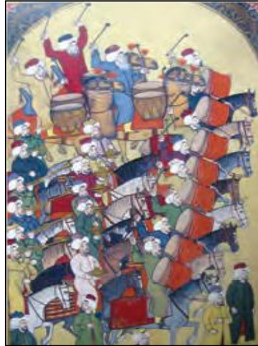
Şekil 1 Yabancılar göre eski Türkler

Ahmed Djevad, Yabancılar Göre Eski Türkler , s. 78-79