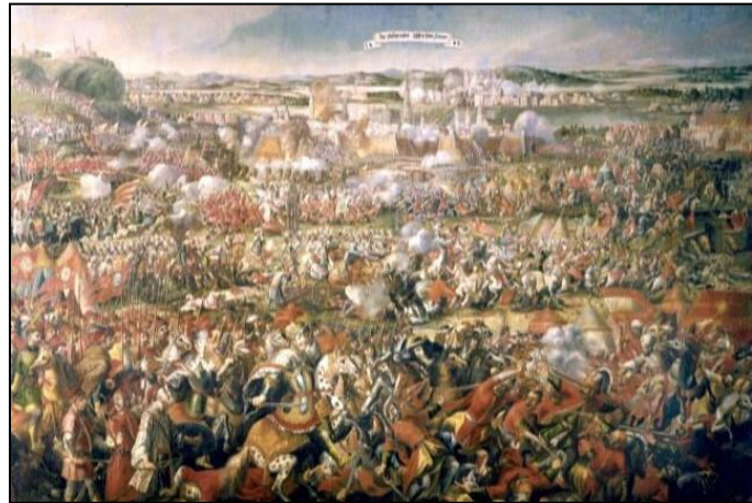
Şekil 10 Kahlenberg yamacından yapılan saldırı

Aynı konuda Habsburgların, topraklarının genişlemesiyle Fransa ve Osmanlı İmparatorluğu gibi iki düşman kazandığı belirtilmiştir. Türklerin Balkan Yarımadası ile Macaristan’ın çoğunu fethettikleri ve 1529’da Viyana’yı ilk kez kuşattıkları, şehri ele geçirememekle birlikte bir tehdit olarak kaldıkları ifade edilmiştir. 17. Yüzyılın ikinci yarısında Türklerin yine büyük bir saldırı başlattıkları, iki ay boyunca şehri kuşattıkları ve İmparator I. Leopold’ün Avusturyalılar, Almanlar ve Polonyalılardan oluşan büyük bir ordu kurmayı başardığı bilgisi verilmiştir. Ardından II. Viyana Kuşatması’nın Viyanalı Osmanlı tarihçisi Richard Kreutel’den alıntılanan Türk günlüğüne göre betimlenmesi ile bu kuşatma hakkında galip Kral Sobieski’nin anlatımına yer verilmiş ve öğrencilerden bu metinleri karşılaştırmaları istenmiştir (Scheucher ve diğerleri, 2013: 138). Ayrıca 1683’teki Viyana Kuşatması’nın Avusturya ve Avrupa tarihi açısından bir dönüm noktası olduğu, bu tarihe kadar Osmanlıların saldırıya geçtikleri ve Avusturyalıların sadece kendilerini savunabildikleri, bu tarihten sonra artık İmparatorluk ordusunun saldırıya geçtiği, Transilvanya ile birlikte bütün Macaristan, Hırvatistan, Slovenya ve Banat’ı ele geçirdikleri ifade edilmiştir. Bu savaşta Prens Eugen’in de muvaffak bir komutan olarak öne çıktığı belirtilmiştir (Scheucher ve diğerleri, 2013: 139).