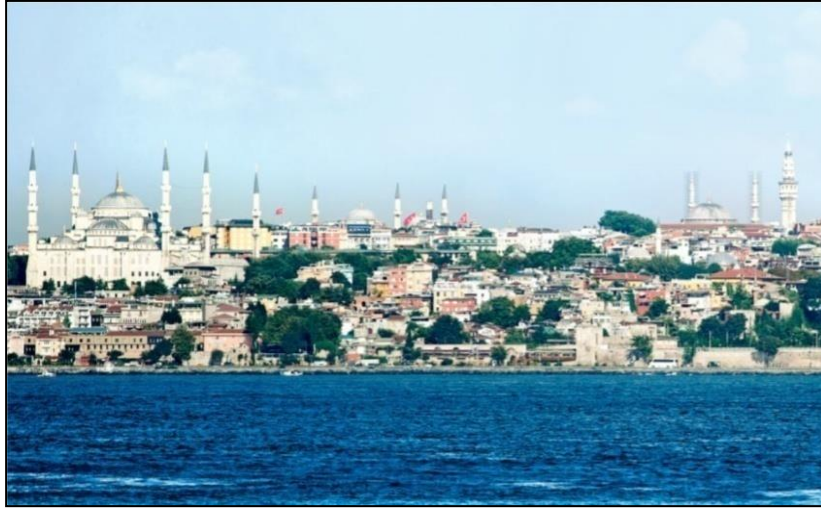
Şekil 8 Ayasofya Müzesi

Aynı konuda Konstantinopol'ün Hristiyanlığın Doğu merkezi olduğundan, uzun süredir Hristiyanlığın en büyük kilisesi olan ve 5. yüzyılda inşa edilen Ayasofya'nın Konstantinopol'de bulunduğundan, buradan misyonerlerin Güneydoğu Avrupa'daki Slavlara ve Rusya'ya Hristiyanlığı götürdüklerinden, iki önemli misyoner olan Kyrill ve Method'un kutsal yazıları Slavca'ya çevirdiklerinden ve bunun için Yunan harflerinden Kiril alfabesini oluşturduklarından bahsedilmiştir (Wald ve diğerleri, 2012: 111). Daha sonra öğrencilerden bir halkın kültüründe yazının neden önemli bir yeri olduğunu tartışmaları ve bugün Kiril alfabesinin hangi ülkelerde kullanıldığını öğrenmeleri istenmiştir. İstanbul'un Slav dillerinde 'Çarın Şehri' anlamına gelen 'Carigrad' ve bunun Kiril alfabesi ile yazım şekli gösterilmiştir. Ayrıca Konstantinopol'ün İstanbul olduğu belirtilmiş ve eski Hristiyan kiliselerinin camiye dönüştürülerek, minarelerle donatıldığı ifade edilip, bununla ilgili bir görsel yer verilmiştir (Wald ve diğerleri, 2012: 111).