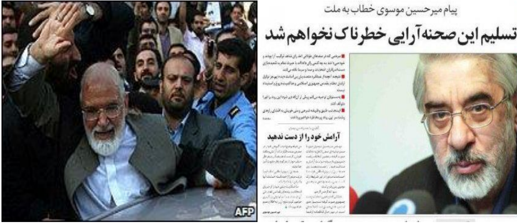
(BBC News, 2010)

İran Devrim Muhafızları yetkililerinden Masoud Jazayeri Ettemad gazetesinin kapatılması ile ilgili olarak, yabancı medya kurum ve kuruluşları ile bağlantılı olanları ‘casus/ajan’ olarak nitelendirmiştir. Bu durum bizlere gazetecilik mesleğine ilişkin mevcut rejimin bürokratik alanlarında sergiledikleri tutumları göstermesi açısından önemlidir (Saeed, 2010).