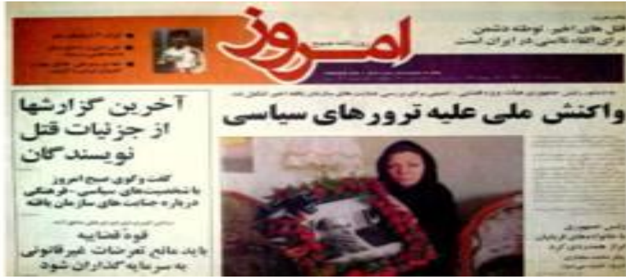
Kaynak: (Yaghoubi, 2013)