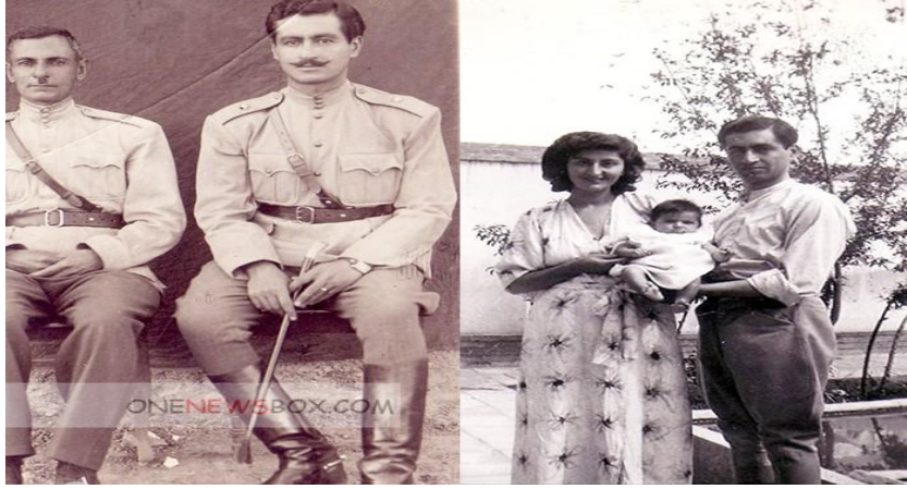
(One News Box, 2018)

Savak, Ali Asgari'nin kaybolması sonrasında ismi duyulmaya başlamıştır. Hakkında fazla bilgi olmaması dolayısı ile en gizemli istihbarat örgütleri arasında yer almıştır. Savak, Şah rejiminde toplumsal düzendeki aksaklıkların baş sorumlusu olarak görüldü ve pek çok Savak Ajanı Ayetullah Humeyni'nin 1979 yılında İran'da devrimi gerçekleşmesi ile birlikte yurtdışına kaçmıştır (Gezici, 2013: 236-237)