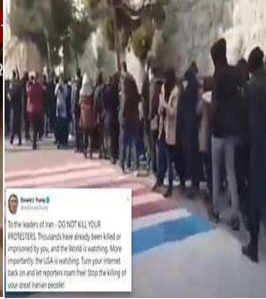
Kaynak: (Fruen, 2020)