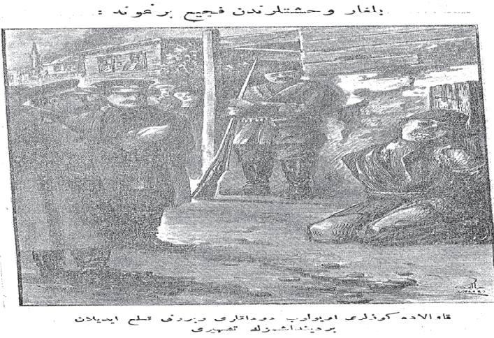
(Âlâm-ı İslâm Rumeli Mezâlimi ve Bulgar Vağşetleri 1913, 43)

müştür. Diğerleri ise Hristiyanlığı kabule mecbur kalmışlardır. Kavala'da ise Rum palikaryaları insanlara eziyet ederler. Bir kadını, kasatura ile memelerini göğsünden kesmek suretiyle öldürmüşlerdir. Sekiz aylık yavrusunu ise süngülere takarak parça parça etmişlerdir. Kavala'da "vahşi Bulgarlar" zavallı Türk annelerinin gözleri önünde çocukları süngü ile öldürmüşlerdir. 79 Bütün bu bilgileri cemiyetin kitabında sadece yazılı olarak görmeyiz. Cemiyet, kitapta çeşitli görseller de paylaşmıştır. Bunlardan biri, Kavala'da gözleri oyulup dudakları ve burnu kesilen bir Müslüman'a aittir.