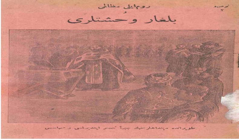
( Âlâm-ı İslâm Rumeli Mezâlimi ve Bulgar Vağşetleri , 1913, Kapak)

yesi ise şöyledir: Âlâm-ı İslâm Bulgar Vağşetleri (İstanbul: Matbaa-i Hayriye, 1328). Bu birinci kitap, 1986 yılında H. Adnan Önelçin tarafından Latin harfleriyle ve sadeleştirilmek suretiyle yayımlanmıştır. 14 Makaleye konu edilen eser ise 1913 senesinde basılır. Kitabın kapağında, Müslümanların Hristiyanlaştırılma merasimini gösteren bir resim yer alır. Resim, Doıran'dandır. 15