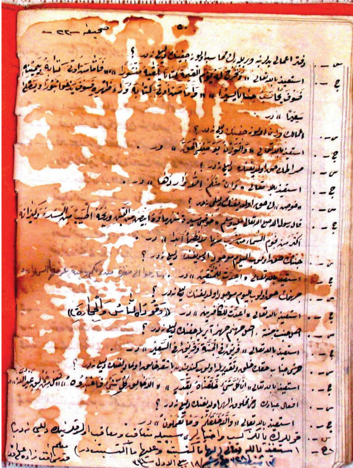
Konya Koyunoğlu Kütüphanesi, nr. 7274 son sayfanın fotoğrafı