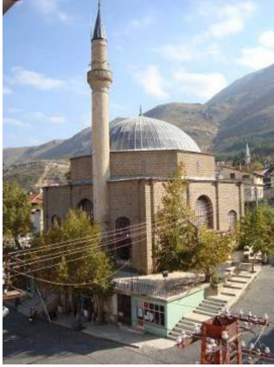
Res.1: Hıdır Çelebi Camii, Genel Görünüm, Kuzeybatı Cephe