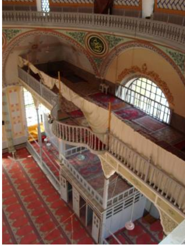
Res.5: İç Mekân, Kadınlar Mahfili