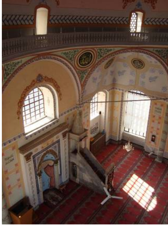
Res.4: İç Mekân-Harim