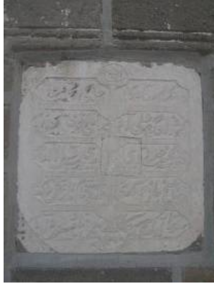
Res.2: Minare, Kitabe