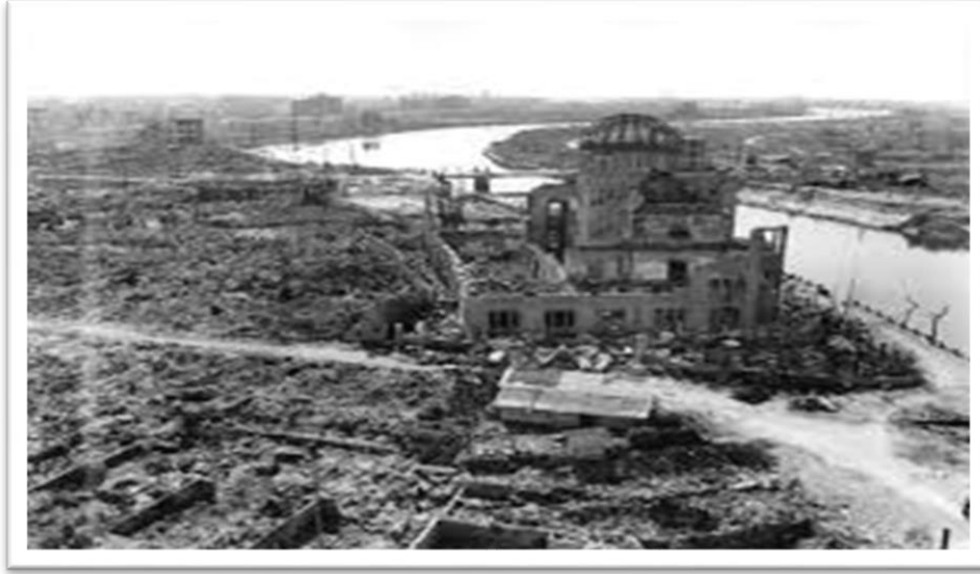
Hiroşima Atom bombasının atıldığı dönem