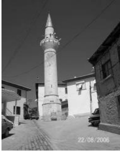
Res.3: Kütük Camii Minaresi