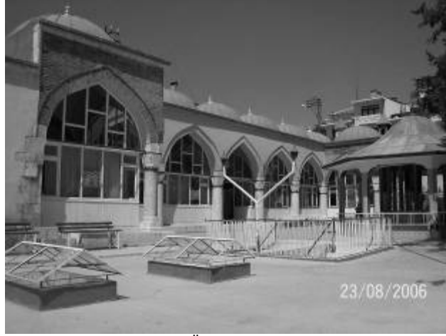
Res.11: Ketenci Ömer Paşa Camii, Medrese