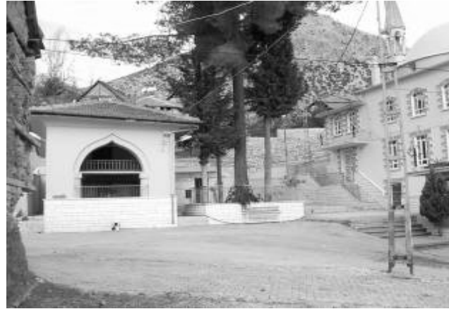
Res.10: Sinan-ı Ümmi Camii ve Türbesi