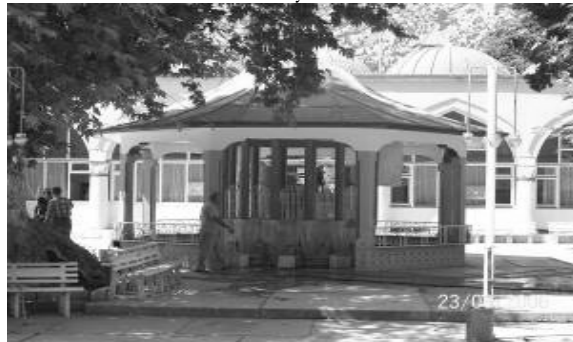
Res.13 Ketenci Ömer Paşa Camii, Şadırvan