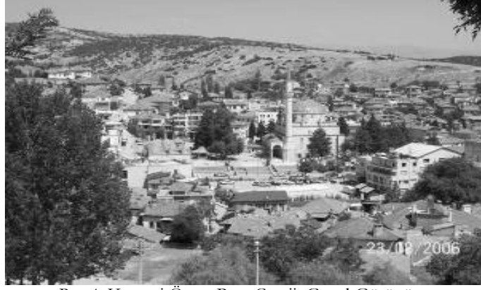
Res.4: Ketenci Ömer Paşa Camii, Genel Görünüm.