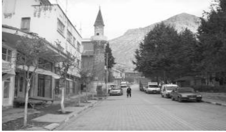
Res.2: Cami-i Atik Minaresi