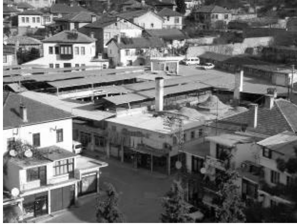
Res.12: Bey Hamamı