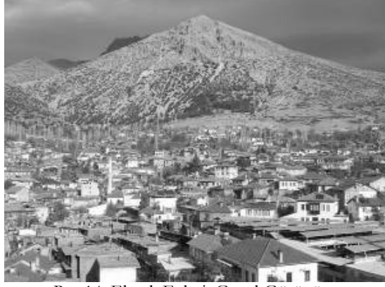
Res.14: Elmalı Evleri, Genel Görünüm.