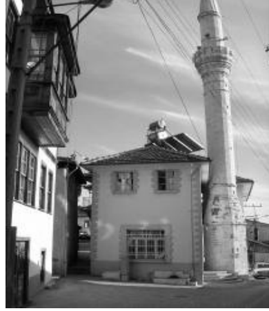
Res.9: Yeni Camii