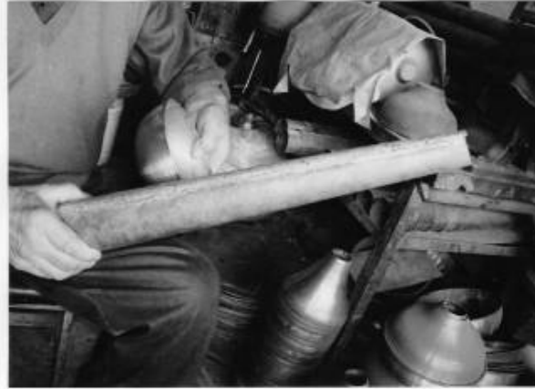
Res.5: Boru şeklindeki dikey eksen alt yapı (Aydođdu, 2008)