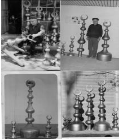
Res.10: Süleyman Ustanın el emeği ürünleri alemler