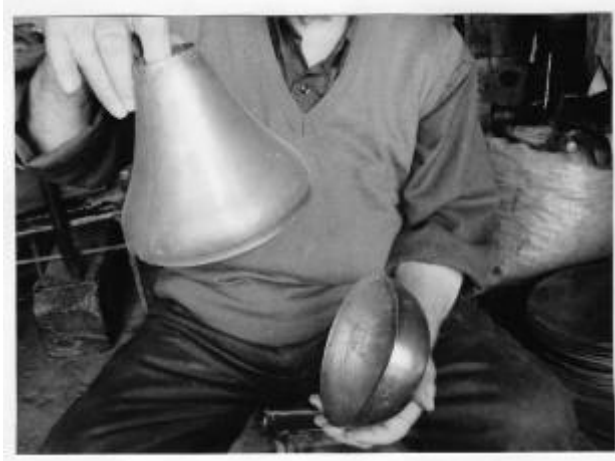
Res.6: Armut altlığı ve armut kısmı (Aydođdu, 2008)