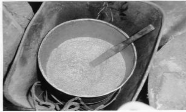
Res.8: Kaplamada kullanılan yaldız malzeme (Aydođdu, 2008)