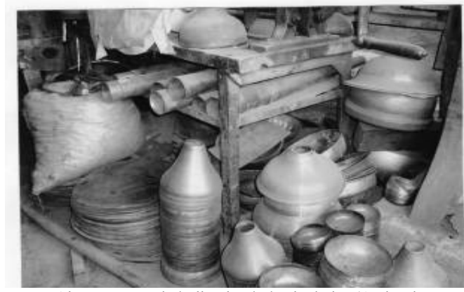
Res.3: Alem yapımında kullanılan bakır levhalar (Aydođdu, 2008)