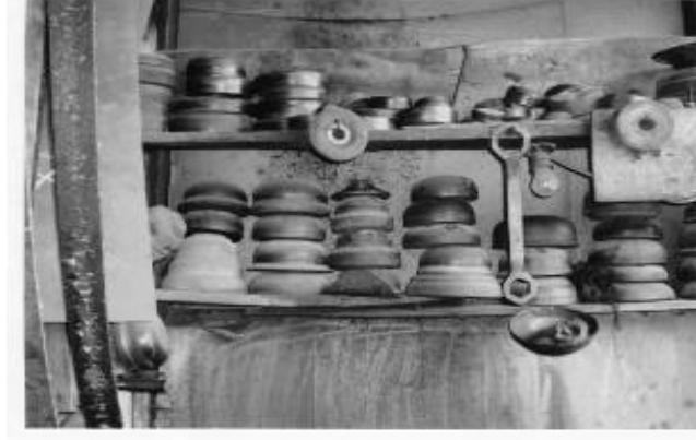
Res. 4: Ahşap Kalıplar (Aydođdu, 2008)