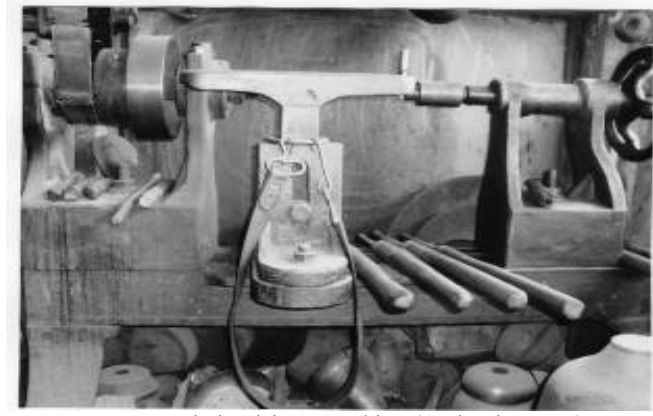
Res.9: Levhaları işleyen makine (Aydoğdu, 2008)