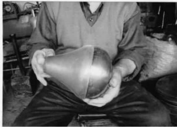
Res.7: Armut altlığı ve armut kısmı birleşmiş vaziyette (Aydođdu, 2008)