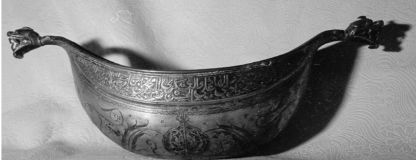
Resim 11. Bakır keşkül, Hacî Bektaş-ı Veli Müzesi, env. no. 55

Üçüncü örnekte ise 40 Hz. Muhammed, Ali, Fatıma, Hasan ve Hüseyin'le ilgili dualar bulunur (Resim 11). Bakırdan yapılmış dördüncü örnekte on iki imamın adı geçer (Resim 12). 41