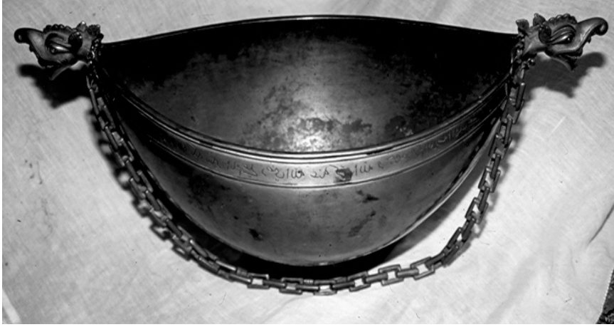
Resim 9. Bakırdan keşköl, Hacı Bektaş-ı Veli Müzesi, env. no. 828.

yanı sıra keşkölün tekkeye vakfedildiğini belirten bir ibare yer alır (Resim 9).