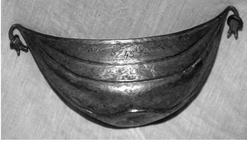
Resim 10. Bakır keşköl, Hacı Bektaş-ı Veli Müzesi, env. no. 45.

Benzer bezeme programı ve üslubu nedeniyle aynı tarihlerde yapıldığını düşündüğümüz diğer örneğin 39 üzerinde dervişlere tasavvuf yolunda rehber olması için sabırlı olmalarını öğütleyen “Tahammül kıl tahammül” şeklinde ibareler yer alır (Resim 10).