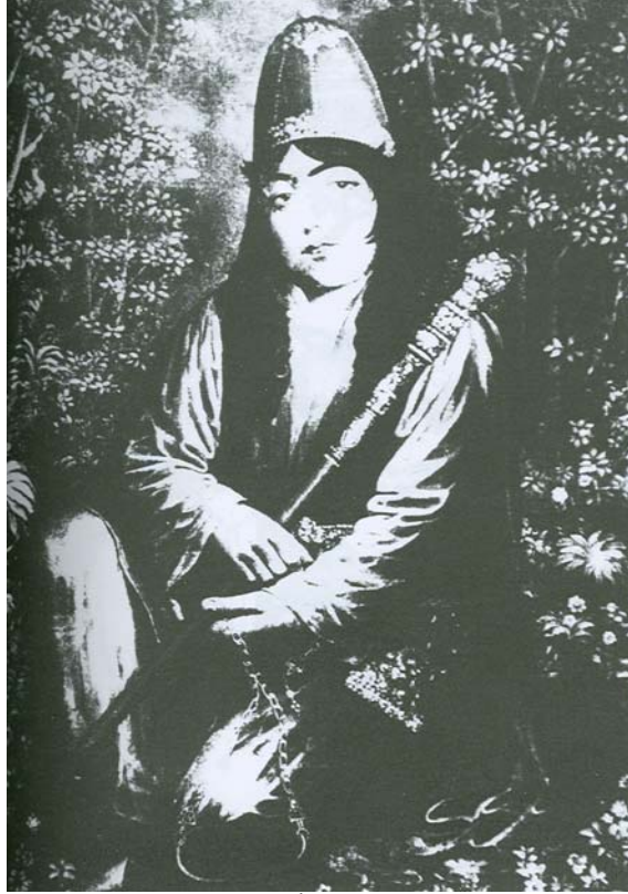
Resim 8. Nur Ali Şah'ın Portresi, İ. Celayir'in Tablosu, 19. yüzyıl, F. M. Hedayet Koleksiyonu (Değirmenci 2000, Lev.18a).

benzerlik tasvirlerde bir derviş modelinin kullanıldığını gösterir. Keşköl, bezeme programı, yazının karakteri ve üslubu açısından İran örneklerine yaklaşmaktadır. Olasılıkla İran'da üretilen keşköl, gezgin bir derviş yoluyla yada Bektaşî tarikatının önemli şahsiyetlerinden birine hediye verilmek üzere Anadolu'ya getirilmiştir.