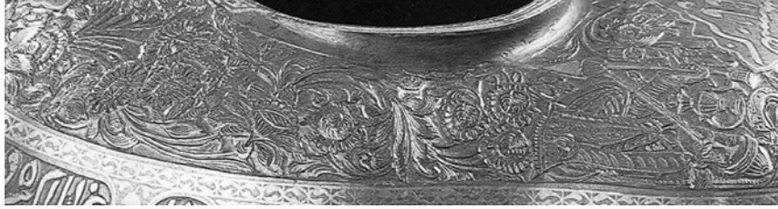
Resim 7. Bakır keşkülden ayrıntı, St. Petersburg Hermitaj Müzesi (Piotrovsky-Vrieze 1999: 131).

Dervişlerin görünümü, İran'da Nimetullahîliğin kurucusu Şah Nimetullah'ın 36 (ö.1429 ?) tasvirlerine benzemektedir (Resim 8). 37 Bu