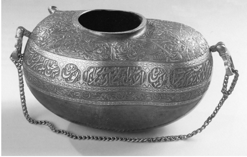
Resim 6. Bakır keşkül, St. Petersburg Hermitaj Müzesi (Piotrovsky-Vrieze 1999, s.131).

Keşkülün üzerindeki bu bezeme programı İran'da üretilen örneklerde de görülür. Bunlardan biri, 19. yüzyıla tarihlenen ve St. Petersburg Hermitaj Müzesi'nde sergilenen keşküdür. 34 (Resim 6-7) 35 .