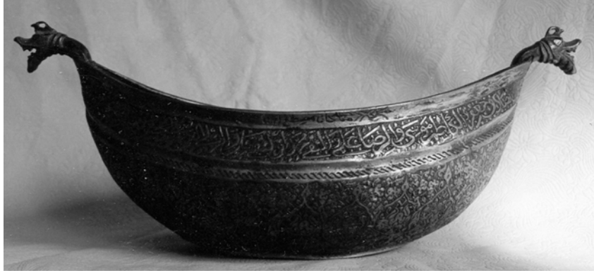
Resim 12. Bakır keşkül, Hacî Bektaş-ı Veli Müzesi, env. no. 830.

Ejderin, daha çok Orta Asya ve Uzakdoğu kaynaklı bir motif olduğu bilinir. Bu figür, toplumların inanç yapılarına göre farklılaşan anlamlar içerir. 42 İslam kaynaklarında korkunç ve zararlı bir hayvan