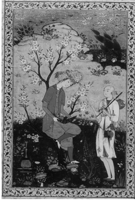
Resim 1. Belinde keşkölüyle bir derviş, Albüm resmi, Prens ve Prenses Sadreddin Aga Han Koleksiyonu, Ir.M. 33, 1590 civarı (Canby 1999, s.69).