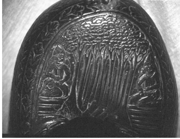
Resim 5. Hindistan cevizinden keşkül, Hacı Bektaş-ı Veli Müzesi, env. no.804.

Hindistan cevizinden kazınma tekniğiyle bezenen keşkülün ağız, dilimli yaprak şeklinde düzenlenmiştir. Ağız kısmını dolaşan ince bir şerit, karşılıklı ejder başları ile sonlanmaktadır. Ejder başlarının bulunduğu bu bölümde ormanlık bir alanda, ağaçların altında diz çökmüş oturan karşılıklı iki derviş tasvir edilmiştir (Resim 5).