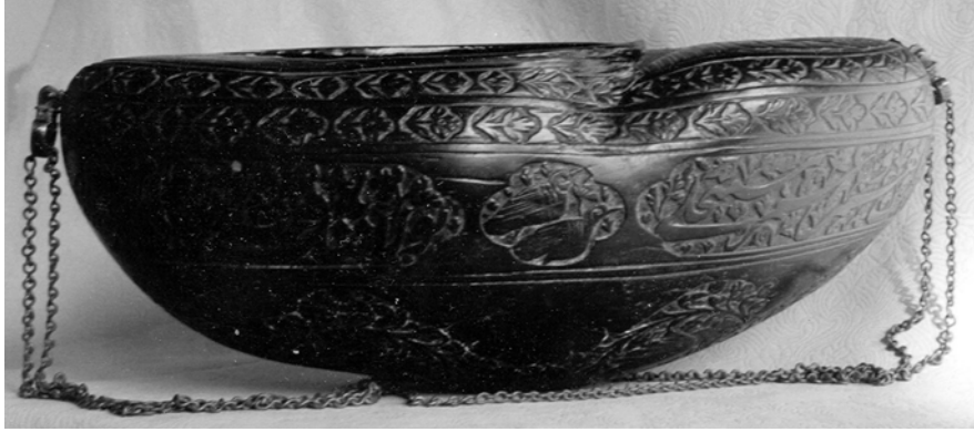
Resim 4. Hindistan cevizinden keşkül, Hacı Bektaş-ı Veli Müzesi, env.no.804.

Hindistan cevizinden kazınma tekniğiyle bezenen keşkülün ağız, dilimli yaprak şeklinde düzenlenmiştir. Ağız kısmını dolaşan ince bir şerit, karşılıklı ejder başları ile sonlanmaktadır. Ejder başlarının bulunduğu bu bölümde ormanlık bir alanda, ağaçların altında diz çökmüş oturan karşılıklı iki derviş tasvir edilmiştir (Resim 5).