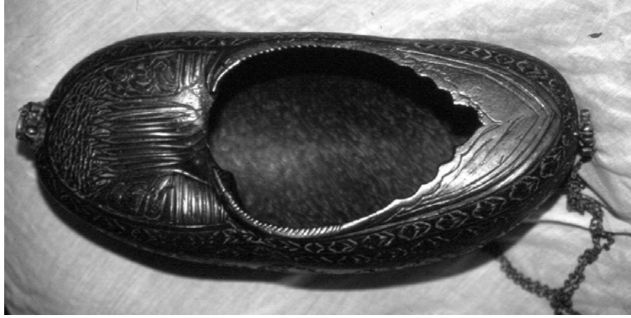
Resim 3. Hindistan cevizinden keşkül, Hacı Bektaş-ı Veli Müzesi, env. no.804.

Dilenme ve fakirlik durumuyla ilişkili olarak Hacı Bektaş Veli Müzesi’ndeki figürlü keşküllerden biri, benzer örnekler ve üslup özelliklerine göre 19. yüzyılın ortalarına tarihlediğimiz derviş tasvirli örnektir (Resim 3-4-5). 32