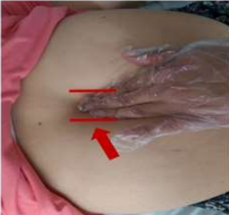
c) DRA muayenesi