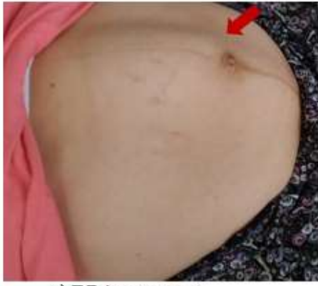
a) DRA görünümü