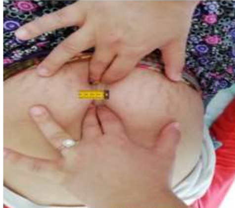
d) DRA açıklığın ölçülmesi