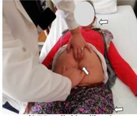
b) DRA elle hissedilmesi