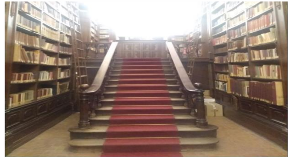
Resim 4. Modern kitaplar bölümü

Kütüphane, danışma masalarının, modern kitap raflarının, yönetim odasının birlikte yer aldığı hol ve giriş kısmı (Resim 3), el yazmalarının kilitli olarak bulundurulduğu bir üst