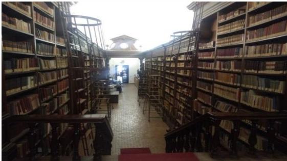
Resim 3. Kütüphane giriş-danışma bölümü

İtalya'nın Roma şehrinde bulunan Vallicelliana Kütüphanesi, bir süre Halk Eğitim Bakanlığı tarafından yönetildikten sonra bugün Kültür ve Turizm Bakanlığına bağlı bir devlet kütüphanesi olarak hizmet vermektedir. Resim 1, kütüphanenin de içinde bulunduğu kompleks yapıyı göstermektedir. İtalyan mimar Francesco Borromini tarafından yapılmış olan bu binanın 2. katı kütüphaneye ayrılmıştır. Resim 2'de kütüphanenin girişi görülmektedir.