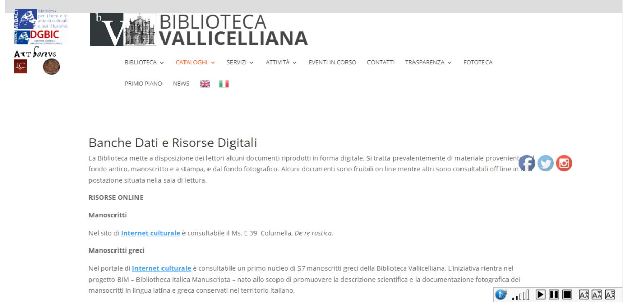
Şekil 7. Vallicelliana Kütüphanesi dijital kaynak ve veritabanı ("Biblioteca Vallicelliana", 2020)

El yazmalarına ve eski eserlere dijital ortamda erişmeyi sağlayan bir başka uygulama "Internet Culturale" veritabanıdır. Bu kaynağa ve sunduğu hizmetlere kütüphane üzerinden de ulaşılmaktadır. Söz konusu veritabanında erişilen kaynaklar, tek sayfa halinde görüntülenebildikleri gibi toplu halde de ekrana yansımaktadır. Ayrıca kaynakları pdf formatında indirmek mümkündür. Şekil 7'de kütüphanenin sunduğu bu hizmetin bir örneği yer almaktadır.