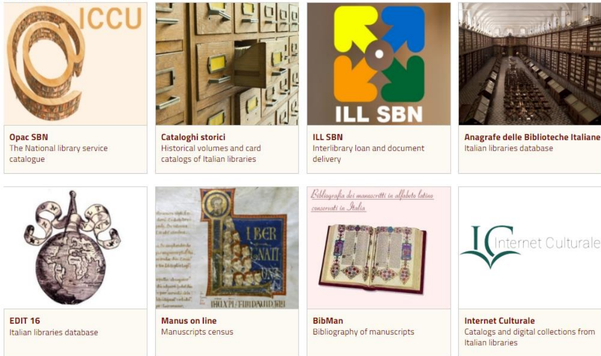
Şekil 6. ICCU online hizmetler ("ICCU", 2019b)