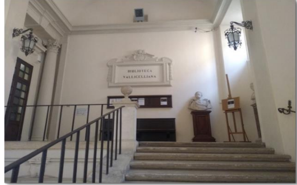
Resim 2. Vallicelliana Kütüphanesi girişi

İtalya'nın Roma şehrinde bulunan Vallicelliana Kütüphanesi, bir süre Halk Eğitim Bakanlığı tarafından yönetildikten sonra bugün Kültür ve Turizm Bakanlığına bağlı bir devlet kütüphanesi olarak hizmet vermektedir. Resim 1, kütüphanenin de içinde bulunduğu kompleks yapıyı göstermektedir. İtalyan mimar Francesco Borromini tarafından yapılmış olan bu binanın 2. katı kütüphaneye ayrılmıştır. Resim 2'de kütüphanenin girişi görülmektedir.