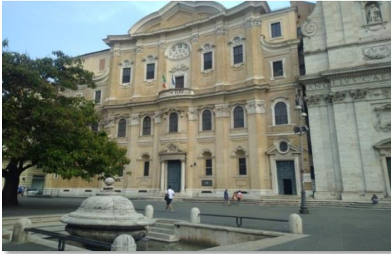
Resim 1. Filippini Oratory kompleks yapı

1946 yılında Vallicelliana'nın fonlarının yönetimi koleksiyonla birlikte kütüphaneye geçmiştir ("Biblioteca Vallicelliana", 2019a).