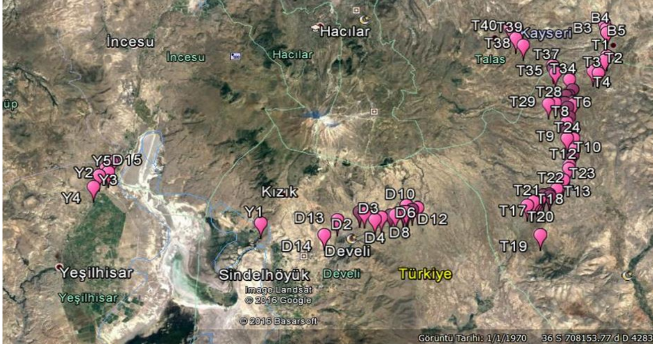
Şekil 1. Kayseri ili çerezlik kabak ekim alanlarında survey yapılan tarlaların uydu görüntüsü ile survey noktaları