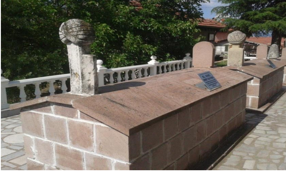
Şeyh Hacı Mehmed Zoravî'nin Sobran köyündeki türbesi