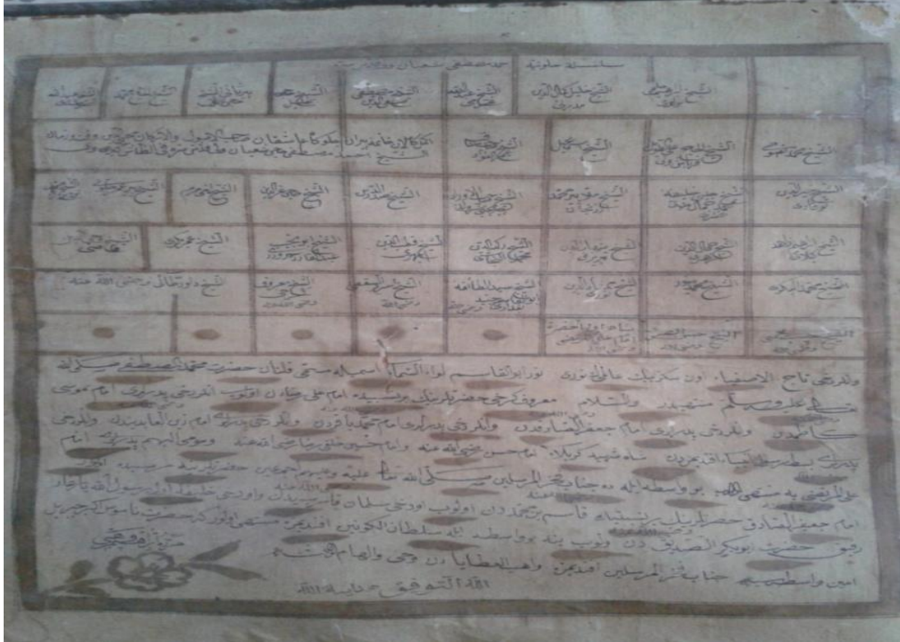
Mehmed Zoravi'nin silsilesini gösteren Zora dergâhında bulunan metal bir levha