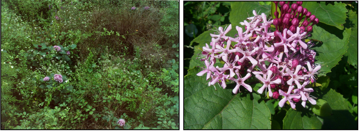
Şekil 1. Clerodendrum bungei türünün Çarşamba ilçesinde doğallaştığı çalılıklar

Shrubs 1-2 m tall. Branchlets subterete, distinctly lenticellate. Petiole 4-17 cm, densely brown, yellow-brown, or purplish pubescent when young, glabrescent; leaf blade ovate to broadly ovate, 8-20 x 5-15 cm, papery, abaxially sparsely glandular pubescent to subglabrous and with several peltate glands near base, adaxially sparsely pubescent, base cuneate, truncate, or cordate, margin serrate, apex acuminate to acute, veins 4-6 pairs. Inflorescences terminal, dense, capitate, flat-topped cymes; bracts lanceolate to ovate-lanceolate, ca. 3 cm, deciduous; bractlets lanceolate, ca. 1.8 cm. Calyx campanulate, tube 2-6 mm, pubescent, with several peltate glands; lobes narrowly triangular to triangular, 1-10 mm. Corolla pinkish, red, or purple, tube 2-3 cm; lobes obovate, 5-8 mm. Stamens and style exserted. Drupes blue-black, subglobose, 6-12 mm in diam. Fl. & Fr. 5-11, Mixed forests on mountain slopes and along roadsides , 1100-2500 m. Medicinal.