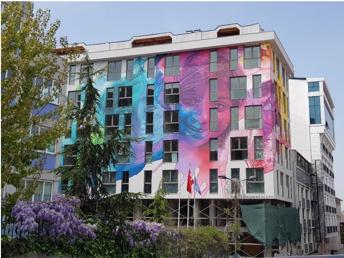
Figür 11: Papillio Apartmanı, Bomonti, 2019.

İstanbul'da mural festivaline ek olarak, duvar resmi ile ilgili 2014 yılında Pera Müzesindeki Duvarların Dili Grafiti ve Sokak Sanatı Sergisi ve 14 Ocak 2016'da Global Karaköy Sanat Galerisi tarafından The Art of Banksy isimli Banksy'nin çalışmalarının dünya prömiyeri gibi dünya çapında aktiviteler de gerçekleştirilmiştir. Hatta, İstanbul'da duvar resmi konusunda dünyada bir ilk olduğu düşünülen Papillio Apartmanı cephesinden de söz etmek gerekir. Şişli Bomonti'de inşaatı 2019'da tamamlanmış olan Papillio Apartmanının cephesi mimarın tercihiyle bir sanat eseriyle, yani bir duvar resmiyle kaplanmıştır (Figür 11). Bu örnekte, tasarımcı sanatçı ile ortak çalışarak yapıyı bir tuval gibi kullanmış, ortaya sağır cephesi ve atıl duvarı olmadan da kentlilere bir görsel şölen sunma fırsatı çıkmıştır. Genel olarak duvar resimleri sağır ve atıl kalmış dış duvarlarda yer aldığı ve mimarlıkta biçim arayışının önemli bir parçası da hiç şüphesiz cephe tasarımı ile gerçekleştiği için Papillio Apartmanı; üzerinde düşünmeye değer bir örnektir. Acaba mimarın form arayışında cephenin bir sanat eseriyle bütünleştirilmesi ne gibi mimari açılımlara olanak verecektir? Gelecekte cephesi bir sanat eseriyle oluşturulmuş yapılarla mı karşılaşılacaktır? Henüz bu sorulara yanıt vermek erken olsa da yakın gelecekte duvar resimlerinin kültür turizmine katkısının süreceği ve sözü edilen bu örneklerin İstanbul'un dünyadaki diğer kentlerle rekabet gücünü arttıracacağı düşünülmektedir.