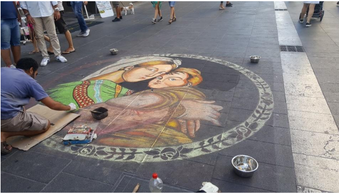
Figür 2: Napoli’de bir kaldırımda tebeşir ile yapılan resim, 2018