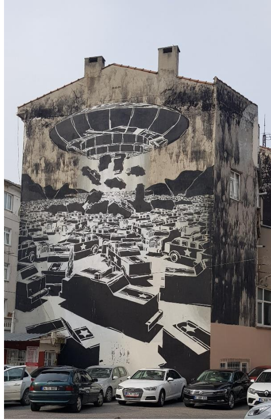
Figür 10: Polonyalı sanatçı M-City tarafından yapılan ve 2014 yılı en iyi 20 duvar resmi arasına giren duvar resmi, Kadıköy

& Anje) bir eser yapılmıştır. Milliyet Gazetesinin 24 Ağustos 2016 tarihli Dilan Özdemir tarafından yazılan internet sayfasında da belirtildiği gibi artık bu eserleri görmek için pek çok dünya kentinde olduğu gibi geziler ve turlar yapılmaktadır. Festival 2020 yılında Covid-19 pandemisi nedeniyle gerçekleştirilememiştir.