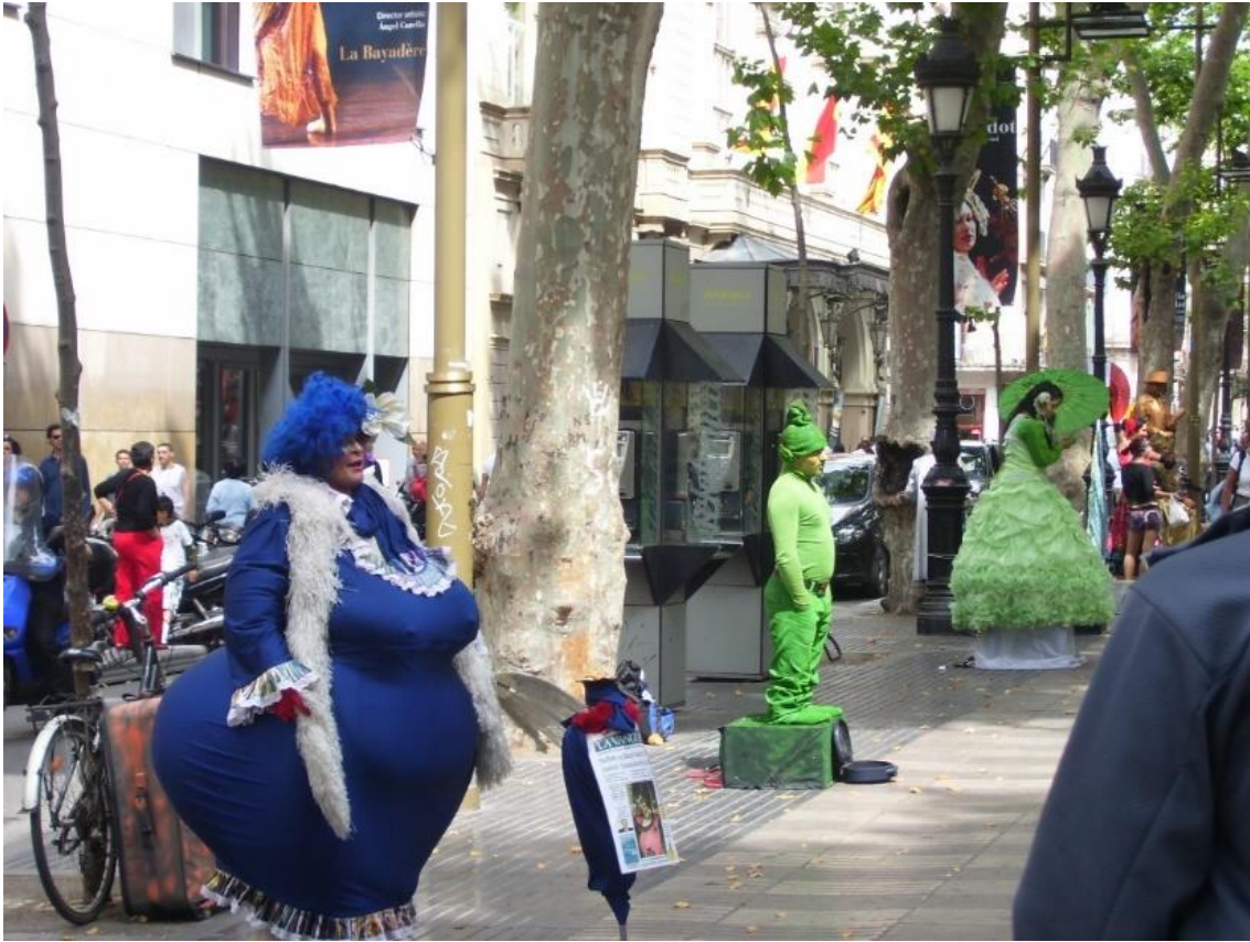
Figür 3: Barselona, Canlı heykeller, 2009.

Canlı Heykellik: Adından da anlaşılacağı gibi sanatçının vücudunun tamamını boyayarak, giydiği kostüm ve aksesuarlarla, gerçek veya hayali kişilikleri, çoğunlukla saatlerce hareketsiz durarak, bazen de karaktere özgü hareketleri tekrarlayarak sergiledikleri performanstır (URL2) (Figür 3). Ülkemizde son yıllarda daha sık görülmesine rağmen halkın genel olarak bilmediği bir performanstır.