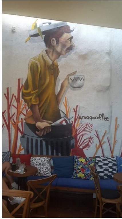
Figür 4: İç mekândaki duvar resmi, Alaçatı, 2018.

Duvar resmi ve grafiti iç içe geçmiş birbirinden etkilenmiş sokak sanatı türleridir. İkisi de sanatsal kaygılar barındırmaktadır. Kullanılan tekniklerde de benzerlikler vardır. Bu nedenle hangi çalışmanın grafiti hangisinin duvar resmi olduğunu söylemek kolay değildir. Ancak genellikle büyük yüzeyleri kaplayan ve izinli olarak yapılmış olanlar duvar resimleridir. Resmin boyutu küçüldükçe izinli olarak yapılmış olma olasılığı da azalmaktadır. Hemen hemen hepsinde bir estetik anlayış olmasına rağmen anonim olan, özgün olmayan, bir sanat eseri olarak değerlendirilemeyecek kadar basit örneklerle de karşılaşılabilir. Özellikle büyük boyutlu duvarlar üzerindeki çalışmalar en özgün, en dikkat çekici ve sanatsal değer taşıyanlar olarak nitelendirilebilirler. Büyük boyutlu duvar resimleri genellikle izinli-çağrılı çalışmalar oldukları için politik mesajlar yerine evrensel mesajlar vermeyi tercih ederler. Duvarlar üzerindeki bu resimler bazı örneklerde bir görsel yanılsama sonucu üç boyutlu eserlere de dönüşebilmektedir (Figür 5).