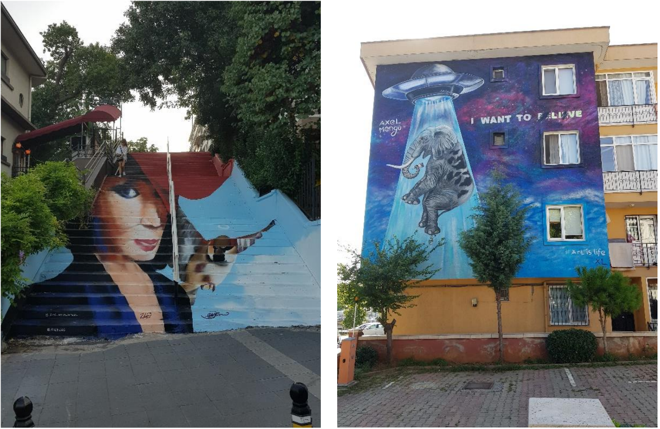
Figür 8 - 9: Kadıköy Mural Festivaline katılan Zag & Anje ve Axel Mengü'ye ait duvar resimleri, 2019.