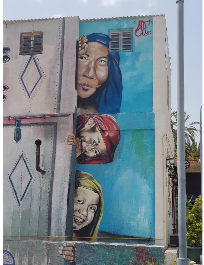
Figür 7: Lefkoşa, KKTC, 2019.