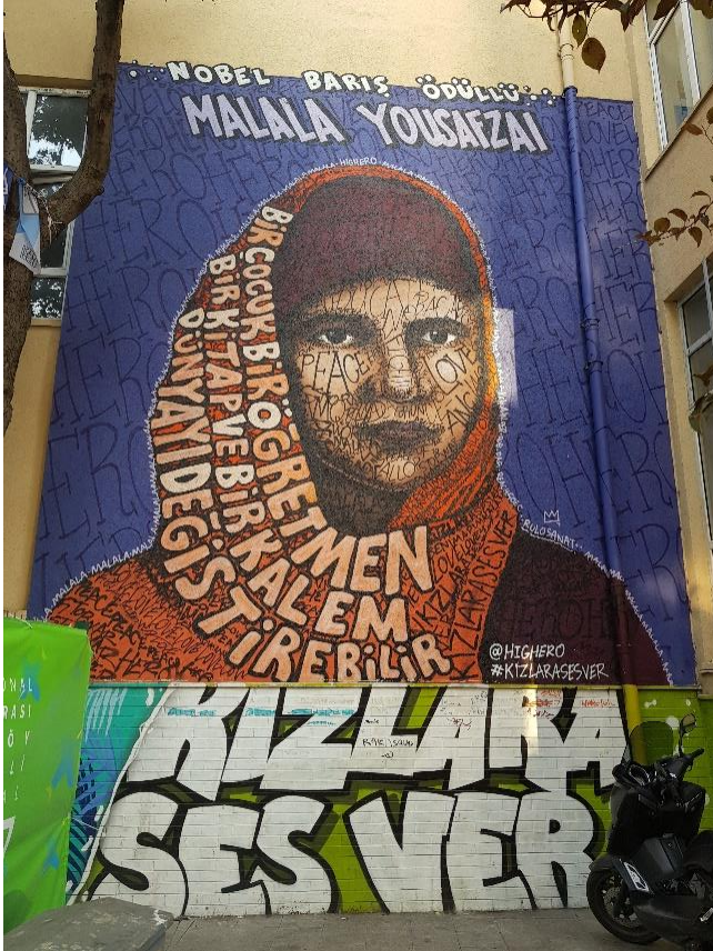
Figür 6: Highero'nun Kadıköy Moda'daki 'Kızlara Ses Ver' İsimli Duvar Resmi, 2019.

İngilizce “mural” olarak isimlendirilen büyük boyutlu duvar resimleri de özünde grafiti sanatının özelliklerini taşımaktadır. Yine çoğunlukla kendini grafitist olarak tanımlayan sanatçılar tarafından icra edilmektedir. Grafitiden ayrılan temel farkı ise yasal bir uygulama oluşudur. Başka bir ifadeyle kamu veya şahsa ait iç veya dış, çoğu sağır duvarlarda izinli ve isteğe bağlı yapılan sanat eserleridir. Grafitiden aldığı ruhla yine toplumun sesi, başkaldırışı, dikkat çekmek istediği gelişmeleri olarak biçimlenebileceği gibi; bir mesaj verme kaygısı olmadan da sanatçının duygu ve düşüncelerini aktarış şekli olarak yorumlanabilir (Figür 6 - 7).