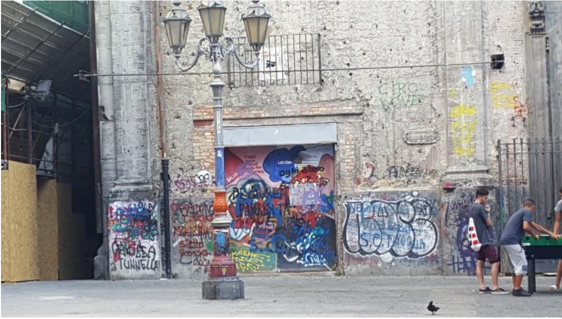
Figür 1: Grafiti, Napoli, 2018.