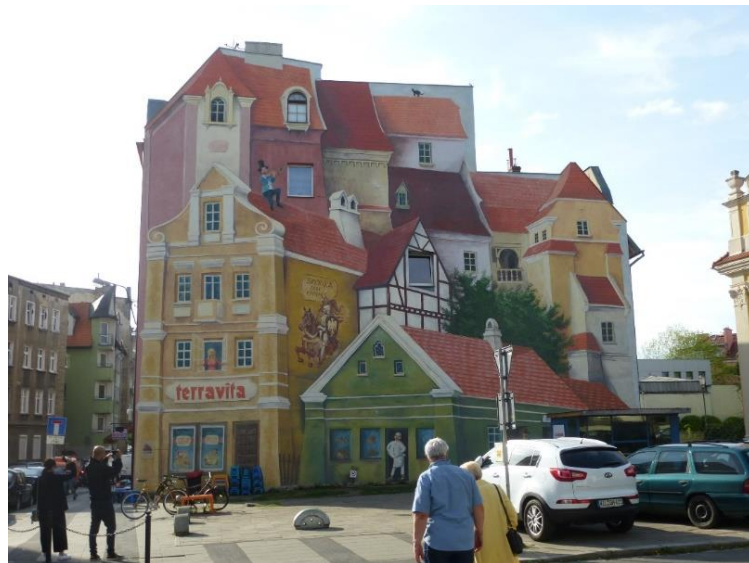
Figür 5: Bina cephesinde 3 boyutlu gibi algılanan duvar resmi, Poznań, 2018.

Duvar resmi ve grafiti iç içe geçmiş birbirinden etkilenmiş sokak sanatı türleridir. İkisi de sanatsal kaygılar barındırmaktadır. Kullanılan tekniklerde de benzerlikler vardır. Bu nedenle hangi çalışmanın grafiti hangisinin duvar resmi olduğunu söylemek kolay değildir. Ancak genellikle büyük yüzeyleri kaplayan ve izinli olarak yapılmış olanlar duvar resimleridir. Resmin boyutu küçüldükçe izinli olarak yapılmış olma olasılığı da azalmaktadır. Hemen hemen hepsinde bir estetik anlayış olmasına rağmen anonim olan, özgün olmayan, bir sanat eseri olarak değerlendirilemeyecek kadar basit örneklerle de karşılaşılabilir. Özellikle büyük boyutlu duvarlar üzerindeki çalışmalar en özgün, en dikkat çekici ve sanatsal değer taşıyanlar olarak nitelendirilebilirler. Büyük boyutlu duvar resimleri genellikle izinli-çağrılı çalışmalar oldukları için politik mesajlar yerine evrensel mesajlar vermeyi tercih ederler. Duvarlar üzerindeki bu resimler bazı örneklerde bir görsel yanılsama sonucu üç boyutlu eserlere de dönüşebilmektedir (Figür 5).