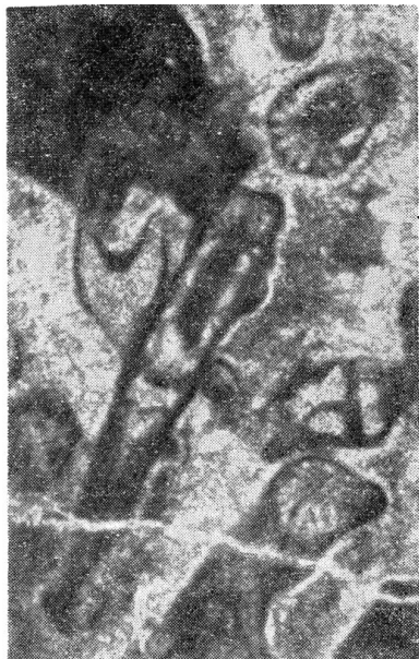
Fig. 1 – Diplopora tulayae n. sp. Coupes longitudinale oblique et transversale oblique (X26) P. M. 134/69.