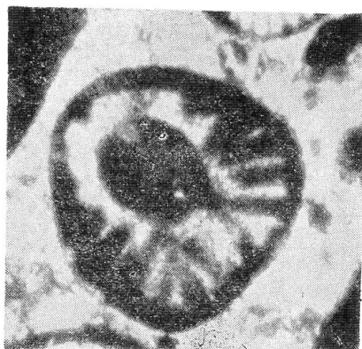
Fig. 4 – Diplopora tulayae n. sp. Coupes transversale oblique passant par l'étranglement (X70) P. M. 148/67.