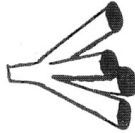
Fig. – 6 Reconstitution du rameau verticillé métaspondyle de Diplora tulayae n. sp.

Le genre Diplopora Schafhäult 1863 n'était connu que du Trias et du Permien supérieur. La présence de ce genre dans le Carbonifère inférieur indique que l'évolution des Dasycladacées avait débuté beaucoup plus tôt que l'on croyait. Les études ultérieures montreront leur présence dans les étages plus anciens. Les espèces dévoniennes de Diplopora (Poncet 1965, 1967) sont des