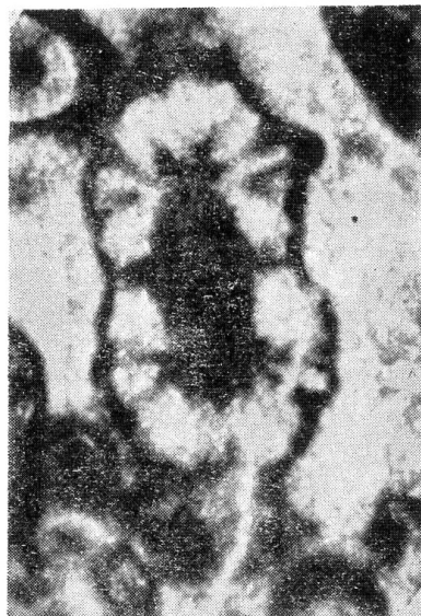
Fig. 2 – Diplopora tulayae n. sp. Coupe transversale oblique montrant les branches métaspondyles (X53). P. M. 134/69.