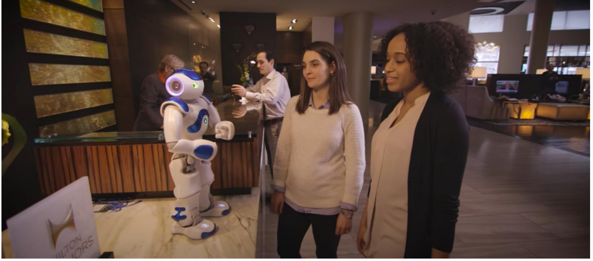
Resim 1. Hilton otelleri ilk robot danışmanı “Connie”