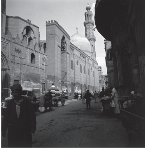
Resim 3. Ez-Zahiriye Medresesi ve Türbesi (Kahire)