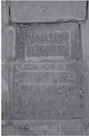
Resim 4. Melik Sunullah Camii Duvar Kitabesi (Malatya)