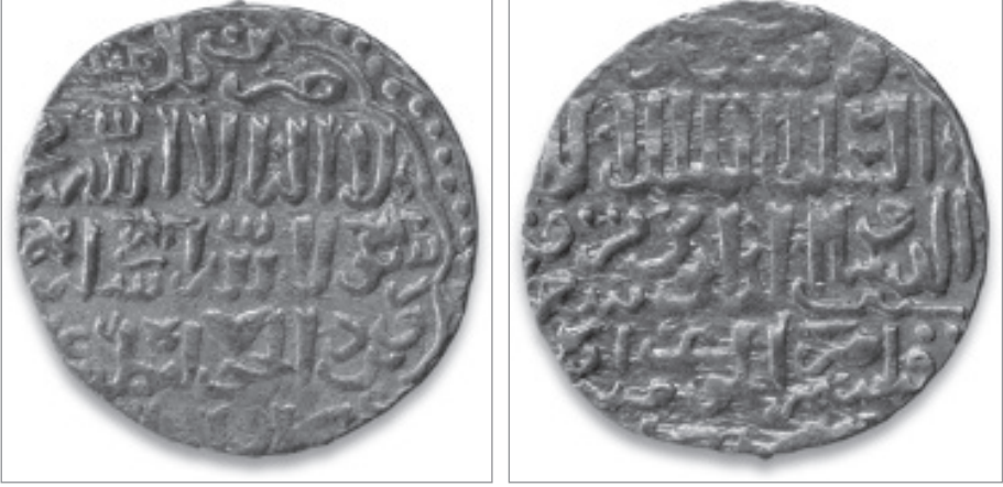
Resim 1. Zahir Berkük Dönemindeki Altın Dinar. Ağırlık: 5.83 gr. Tarih: 1382-83 Darp Yeri: Dimaşk