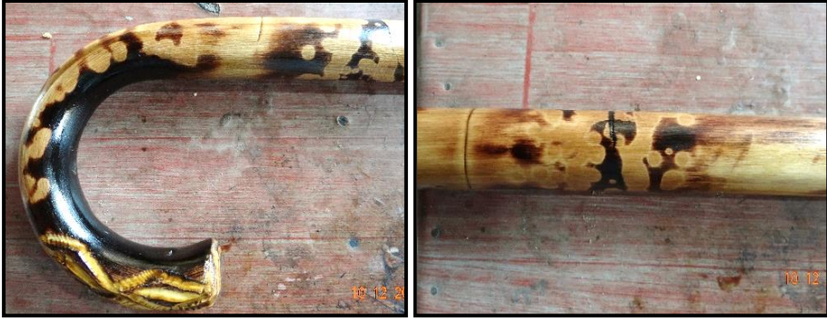
Fotoğraf 5. Beykoz Bastonu 'nda Kireç Yakarak Yapılan Dekorlama Detayları

Beykoz bastonu için hâlâ geleneksel yöntemlere bağlı kalınarak gomalak cila kullanılır. Bu iş için gerekli gomalak ithalat yoluyla sağlanmaktadır. Son aşamada ise hazırlanan gomalak cila bir miktar suyla inceltilerek ilk astar çekilir. Kurumaya bırakılan bastonlar daha sonra tekrar zımparalanır (Arap kâğıdıyla) ve bu defa saf gomalak cila ile cilalanır. Gomalak cilaya katılan balmumu ise Dereseği mahallesindeki sınırlı olarak sürdürülen arıcılık faaliyeti kapsamında ustanın kendi üretiminden karşılanmaktadır. 4 Kullanılacak cila için ispirto ve çam sakızı da gerekmektedir. İlk etapta gomalak ve ispirto karıştırılır ve 2 gün boyunca her yarım saatte veya saat başı çalkalanır. İki günün sonunda naylon çorapta süzülen karışıma eritilmiş ve aynı şekilde süzölmüş çam sakızı ve balmumu karıştırılır. Hazırlanması 2 günü bulan baston cilası hava almadığı müddetçe 2 – 3 yıl dayanıklılığını korur fakat hava alması durumunda kısa sürede sertleşir ve kullanılamaz hâle gelir. İki aşamadan oluşan bu cilalama sayesinde bastonlar daha parlak bir görünüm kazanır. Cilalama önce saptan başlar ve kurumaya bırakılır, sonrasında gövde cilalanır. 60 kadar bastonun cilası 1 gün sürmektedir.