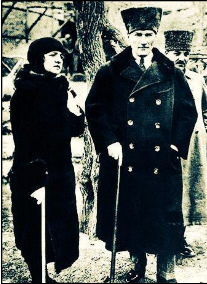
Fotoğraf 1. Gazi Mustafa Kemal ATATÜRK ve Eşi Latife Hanım Akseuar Amaçlı Kullandıkları Bastonlarıyla