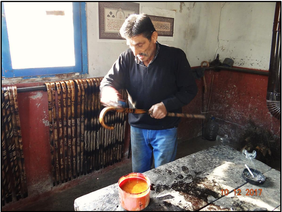
Fotoğraf 7. Hazırlanan Gomalak Cila ile Beykoz Bastonu 'nun Cilalanması

Karakteristik bir Beykoz Bastonu 'nun ortaya konmasında sadece 20 gün hammadenin hazırlanması sürmektedir. 20 günün sonunda baston yapımına hazır hâle gelen dallardan 1 günde 30 tane ortaya konabilmektedir. Fakat burada dikkat çekilmesi gereken önemli bir noktada ustasının tek seferde bir bastonun bütün aşamalarını tamamlamadığıdır. Aynı anda 30 kadar bastonun sadece pürmüzü ya da cila işi yapılmaktadır.