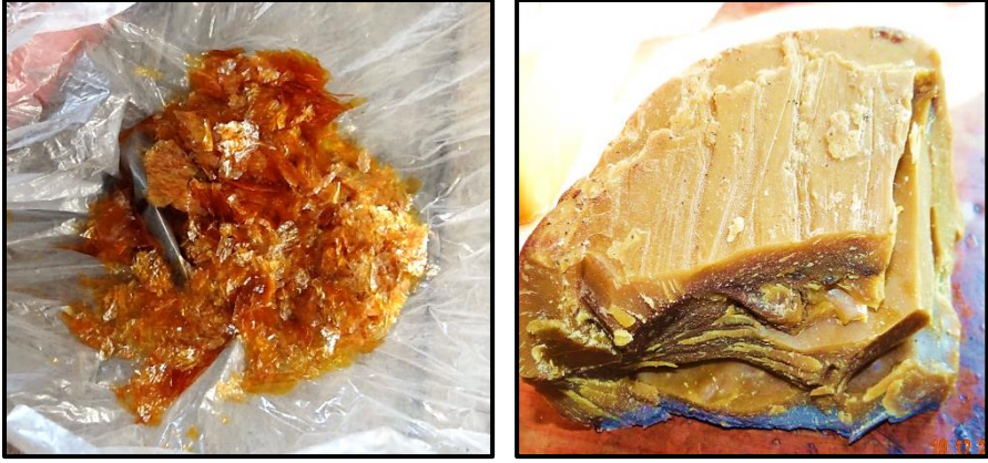
Fotoğraf 6. Beykoz Bastonu Cilalamada Kullanılan İki Önemli Malzeme: Solda Gomalak ve Sağda Balmumu