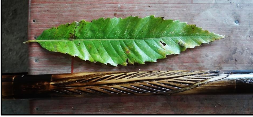
Fotoğraf 4. Beykoz Bastonu 'ndaki En Yaygın İşleme Kestane Yaprığı Motifidir

ağacın yapısal özelliğinden kaynaklı olabilecek kılcal boşluklar ağaç tutkalı ve balmumu karışımıyla doldurulur. Bu dolgu işleminin ardından da Arap kâğıdı da denilen kullanılmış eski zımparalarla tekrar zımparalanır.