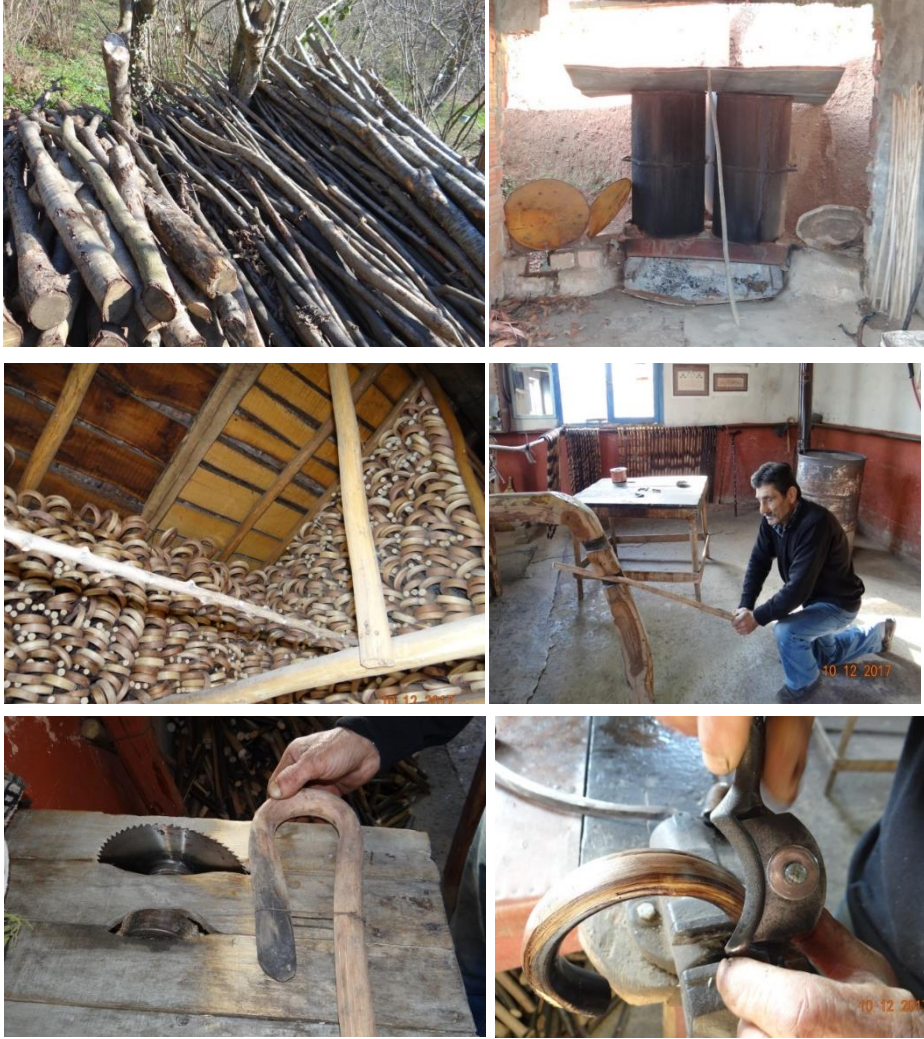
Fotoğraf 3. Beykoz Bastonu 'nun Elde Ediliş Biçimi ve Yapımından Çeşitli Görüntüler

Daha sonra desen verme işlemine geçilir. Beykoz Bastonu , esasında yoğun işleme-ciliğin olduğu bir baston olmayıp yine de karakteristik belli başlı uygulamalar vardır. Yakarak eskitme görünümü verme, sap kısmının ucunda çentikler (sular) açılarak yapılan süsleme ve son zamanlarda sadece bir usta tarafından yapılan kireçle dekorlama en yaygın olanlardır. Kireçle yapılan dekorlamada suyla söndürülmüş kireç bastonun muhtelif yerlerine serpilir ve daha sonra yakma işlemine geçilir. Yakılan bastonlar bir müddet dinlendirilir ve daha sonra yüzeydeki kireçler talaşla temizlenir. Kireçli yüzeylerin yanmamasından kaynaklı doğal bir desen oluşur. Bir diğer yaygın motif ise kestane yaprağı desenidir. Kestane ağacından yapılan baston için kestane yapraklarından esinlenerek yapılan bu motif yoğun bir şekilde kullanılır. Desen verme işleminden sonra 80 numara zımpara ile zımparalama işlemine geçilir. Cilalama safhasına geçmeden önce