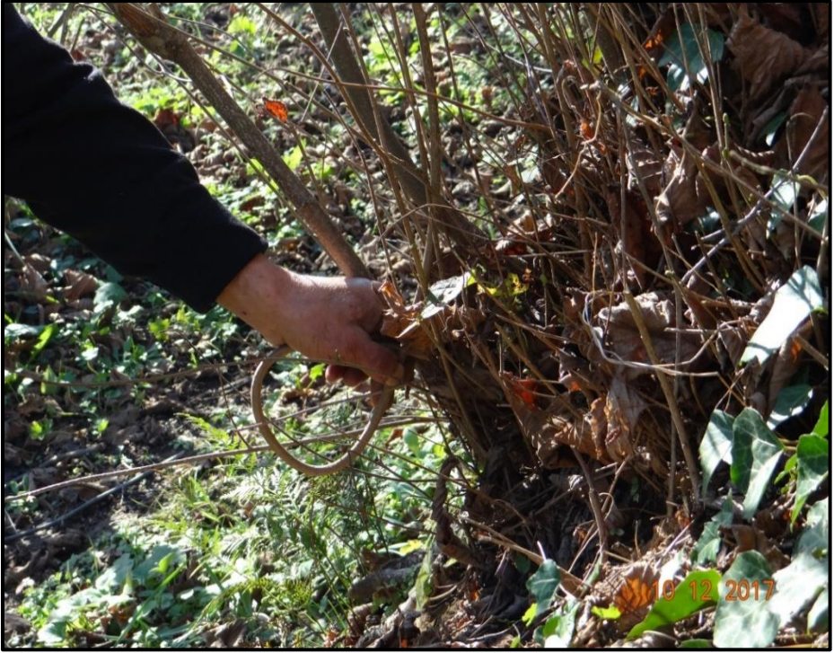
Fotoğraf 2. Genç Sürgünler Baston İçin Kesilmeye Hazır Hâle Gelene Kadar Saplari İçin Eğrilik Vermek Adına Bükülüp Bağlanır

boyunca sürekli soba yakılarak kurutma işlemi gerçekleştirilir. Toplamda 20 günün sonunda baston olarak işlenmeye hazır hâle gelen dalların ilk etapta telleri sökülür ve testereyle uygun boyda kesilir. Beykoz Bastonu için standart boy 95 cm.'dir. Daha sonra doğrultma tahtasına alınarak pürmüzleme aşamasına geçilir. Bu aşamada bastona hem eskitme görünüm kazandırılır hem de sap kısmı için tekrar tel takılarak yapılan ısıtmayla bastona daha da dayanıklılık kazandırılır. Pürmüzleme denilen aşama 2 – 3 dakika kadar sürmekte olup Beykoz Bastonu 'nun geleneksel süsleme metodudur. Eskitme görünümü vermek adına yapılan uygulama için ev tüpü ve şaloma kullanılmaktadır. Yine klasik bastonculuk araçlarından farklı olarak pirinç sap kalıplar kullanılmaktadır.”