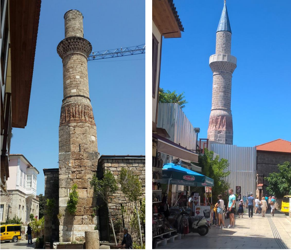
Res. 3: Minarenin restorasyon öncesi görünümü (URL 8).