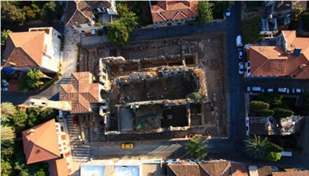
Res. 5: Kesik Minare'nin müdahale öncesi üstten görünüşü (URL 3).