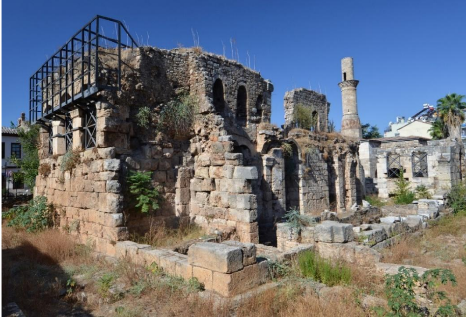
Res. 1: Kesik Minare'nin müdahale öncesi 2007 yılında yerleştirilen çelik konstrüksiyonlar ile kuzey doğudan görünümü (URL 6).