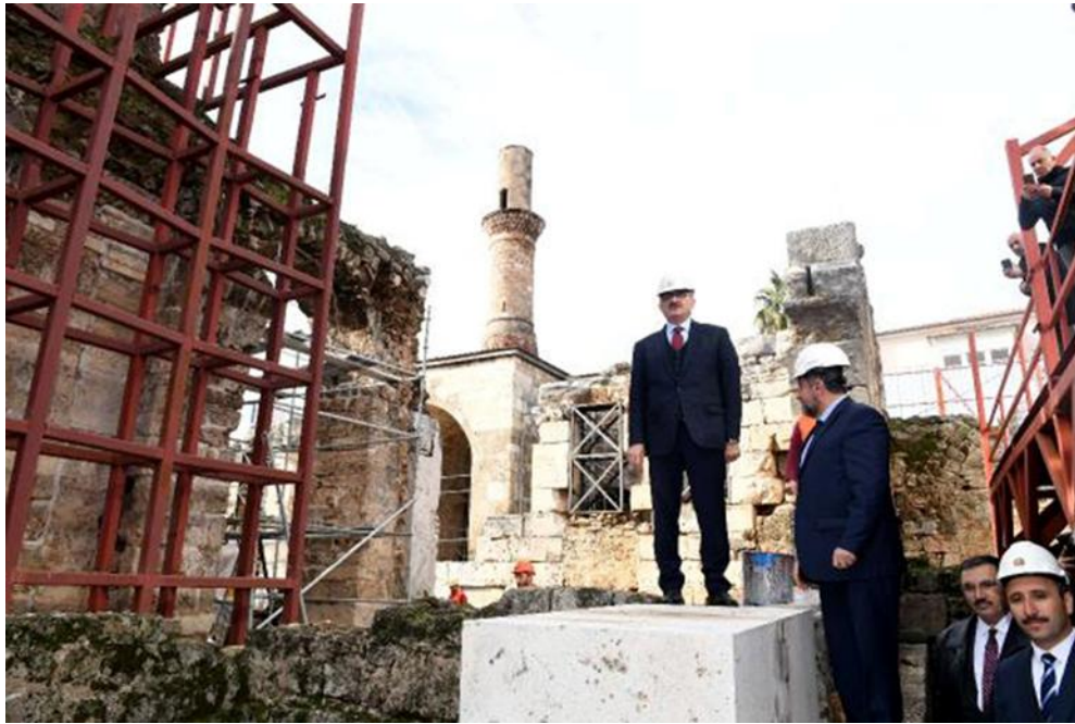
Res. 2: Cami inşaatını başlatma ve ilk taşın yerleştirilmesi töreninde zamanın Antalya Valisi ve Vakıf üyeleri (URL 7).