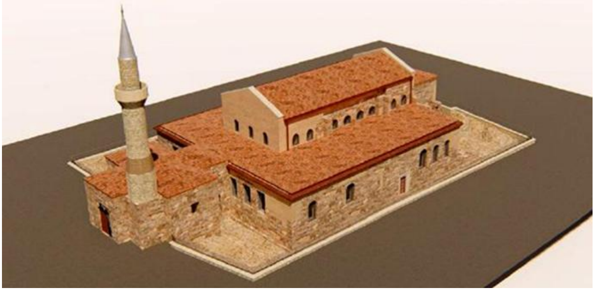
Res. 6: Projenin bitmiş halini temsil eden maket görünümü (URL 7).