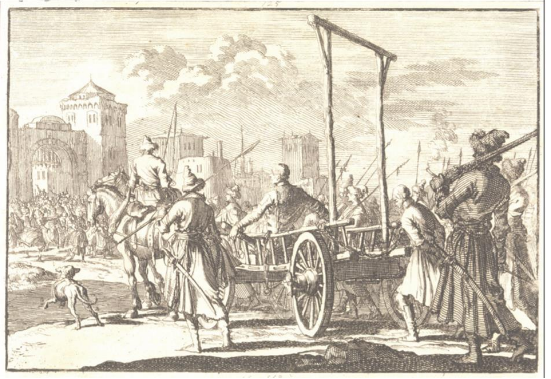
Razin kardeşleri Moskova'ya getiren araba (1630-1671)