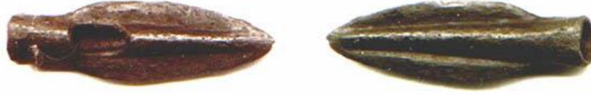
Figür 3: MÖ VII. yüzyıla tarihlenen, İskitlerin kullandığı ok ucu biçimindeki para 45

Ortalama 0,70 – 4,01 gram aralığında ağırlığa ve 17 – 32,2 milimetre aralığında uzunluğa sahip olan bu tip paraların en eski örnekleri; Apollonia, Olbia ve Histria kentlerinde, vazoların içinde bulunabilmiştir 46 . Ok ucu biçimindeki paralar, özellikle Kuzeybatı Karadeniz kıyı kentlerinden olan MÖ VI. ile MÖ IV. yüzyıllar arasında Apollonia, Kerkinitis, Tomis, Histria, Nikonion, Berezan ve Olbia'da yoğunlukla kullanılmıştır 47 . Ok uçları; arkeolojik çalışmalar sonucunda bu kentlerde yer alan mezar alanlarında yoğun olarak bulunmuş ve bu materyallerin buraya savaş aleti ya da başka bir amaçla yerleştirildiği konusunda bazı farklı görüşler oluşturmuştur. Karadeniz'in kuzeyindeki İskit kurganlarında ölen kişinin yanına savaş aletlerinin de yerleştirildiği bilinmektedir. Bunun yanında savaş aleti olarak kullanımının amaçlanmadığı ok uçları da kurganlar içerisine yerleştirilmiş ve kişinin öldükten sonraki gideceği dünyada savaş aletleri ile birlikte paraları da kullanabilmesi amaçlanmıştır 48 . Kurganlardan çıkarılan ve para yerine kullanılan ok uçlarının önemli bir bölümü, günümüzde Köstence Sanat Müzesi'nde sergilenmektedir 49 . Grek kolonileri içinde İskit tipi paraların kullanılması, bu bölgelerde İskit egemenliğinin sadece askeri alanda sınırlı kalmayıp, ekonomik alanda da varlığını gösterdiğini açıklamaktadır.