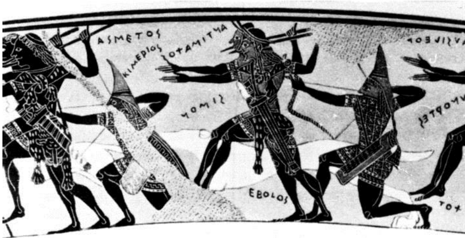
Figür 1: François Vazosu üzerindeki Kimmer savaşçısı betimlemesi 13

Kimmer savaşçılarının ok-yay kullandığına ilişkin en ayrıntılı betimlemeler François Vazosu’nda yer almaktadır. Kalydonia domuz avının canlandırıldığı frizde, sivri başlıklı ve yayını germiş olarak görülen kişinin üzerinde “KIMERIOS” yazısı dikkat çekmekte ve Kimmer savaşçılarının kullandığı savaş aletlerinin yanı sıra giysileri hakkında da önemli bilgiler vermektedir (Figür 1). MÖ 575 ile MÖ 570 arasına tarihlenen bu vazo; Kalydonia domuz avı, Patroklos'un cenaze töreni, Thetis'in düğününe katılan tanrılar alayı, Achilleus ve Troilos ve değişik hayvan mücadeleleri sahnelerini içerir 12 .