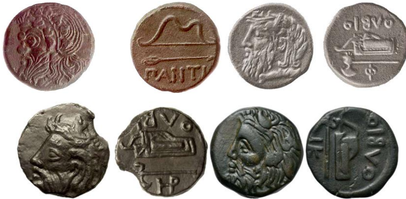
Figür 7: MÖ IV. yüzyıla tarihlenen, Panticapaeum ve Olbia madeni paralarından örnekler 66

MÖ IV. yüzyıldan başlamak üzere Grek kolonileri içinde yuvarlak biçimli ve Grek sikkelerinin yapısında oluşturulan madeni paraların kullanıldığı bilinmektedir. Ok uçlu madeni paralar biçimsel olarak değişip, zamanla yerini yuvarlak biçimli ve Grek tipi madeni paralara bırakmış olsa da, bir yüzünde ok ve yay betimlemesinin yer alması; Kimmer - İskit geleneğinin devam ettirildiğini göstermektedir. MÖ IV yüzyıla tarihlenen Panticapaeum kenti adına basıldığı anlaşılan madeni paranın bir yüzünde kentin yöneticisi olduğu anlaşılan kişinin betimlemesi yer alırken diğer yüzünde ise İskit tipi ok – yay ve kentin adı (PANTI) yer almaktadır. Olbia kenti paralarında ise paraların bir yüzünde yine kenti yöneten kişinin betimlemesi bulunurken arka yüzüne içinde yay bulunan bir sadak ve savaş baltası kabartmaları işlenmiştir (Figür 6).