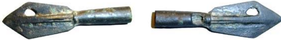
Figür 2: MÖ VIII. yüzyıla tarihlenen, Kimmerlerin kullandığı ok ucu biçimindeki para 44

Karadeniz’in kuzey kıyılarında alışveriş amaçlı kullanıldığı bilinen en eski materyaller, ok ucu biçimindeki madeni paralardan oluşmaktadır 42 . Arkeolojik bulgulara göre, Kimmer toplumunda para kavramı ok uçlarına karşılık gelmektedir. Odessa Numismatik Müzesi envanterinde yer alan Kimmer ok uçlarının; savaş ve avlanma amaçlı kullanılabilenken, aynı zamanda alışveriş yapabilmek için de para olarak geçerli bulunabildiği anlaşılmaktadır 43 . MÖ VIII. yüzyılda Kimmer ülkesinde yaşayan halkın günlük alım ve satım işlemlerinin ok uçları aracılığı ile gerçekleştirildiği ortaya çıkmaktadır (Figür 2). Aynı ekonomik geleneğin Karadeniz’in kuzeyinde yaşayan İskit halkı tarafından da devam ettirildiği görülmektedir. Kimmer ok uçlarına göre daha farklı bir biçimde yapılmış olan ve İskitlerin Kuzey Karadeniz’deki egemenliğinin erken dönemleri sayılabilecek bir zamana tarihlenen MÖ VII. yüzyılda; İskitler ok uçlarını kullanarak ekonomik etkinliklerini gerçekleştirdikleri anlaşılmaktadır (Figür 3). Kimmerler ve İskitler arasında değişim aracı olarak ok ucu biçimindeki paraların kullanılmasında onların demir dökümcülüğünün getirdiği bir alışkanlıktan dolayı kaynaklandığı düşünülebilir. Yüzyıllar boyu ok ucu yapımı için kendi döküm kalıplarını oluşturan Kimmer ve İskit demir dökümcüleri; para yerine geçebilecek bir materyal üretirken, ok ucu yapımında kullanılan standart kalıbı para yapımı için de kullanıp, ok ucu biçimindeki paraları ortaya çıkarabileceği varsayılabilir.