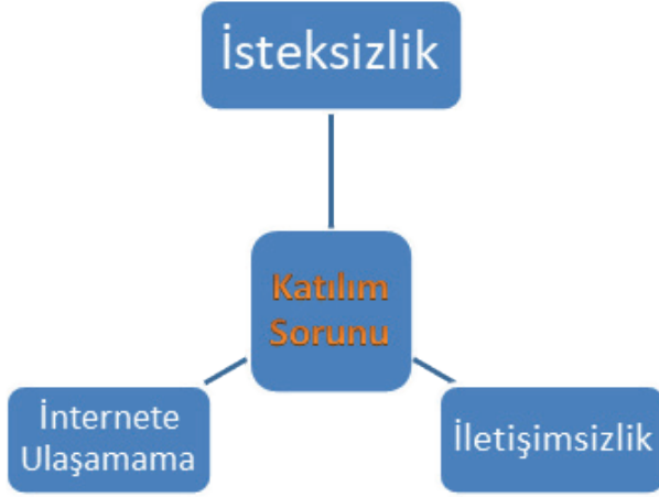
Şekil 1. Zorluklar Teması ve Alt Kategorileri

Türkçe öğretmenleri uzaktan eğitim sürecinde yaşadıkları katılım sorununu; iletişimsizlik, internete ulaşamama ve isteksizlik ile açıklamışlardır. Öğretmenlerin görüşlerinden örnekler aşağıda sunulmuştur: