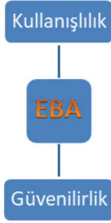
Şekil 3. EBA Teması ve Alt Kategorileri

Öğretmenlerin tamamı EBA'yı kullandıklarını belirtmişlerdir. 4 öğretmen whatsapp'ı, 3 öğretmen zoom'u da kullandıklarını belirtmiştir. Öğretmenler en çok kullandıkları programın EBA olmasının nedenini; devletin kendi programı olduğu için güvenilir olduğunu düşündükleri biçiminde ifade etmişlerdir. Öğretmenlerin görüşlerinden örnekler aşağıda verilmiştir: