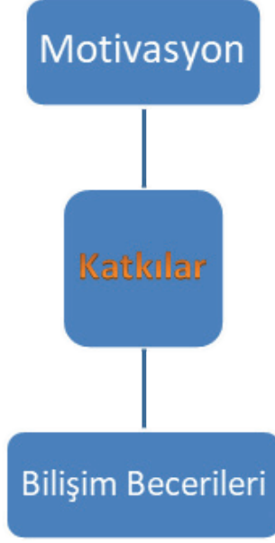
Şekil 2. Katkılar Teması ve Alt Kategorileri

Türkçe öğretmenleri Katkılar temasını; bilişim becerileri ve motivasyon ile ifade etmişlerdir. Aşağıda öğretmenlerin görüşlerinden örnekler verilmiştir: