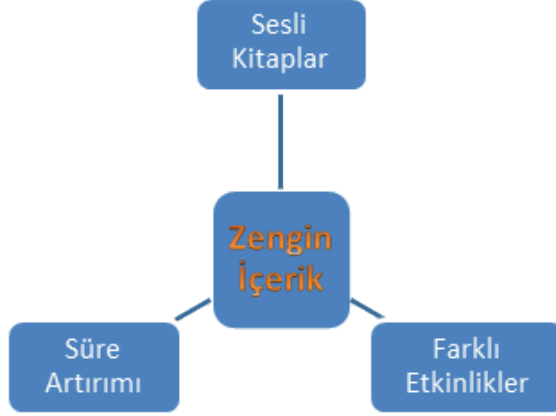
Şekil 4. Zengin İçerik Teması ve Alt Kategorileri

Türkçe öğretmenlerinin uzaktan eğitim kanallarını geliştirmeye ilgili görüşleri Zengin İçerik adıyla temalaştırılmış ve ilgili alt temaları Şekil 4'te sunulmuştur.