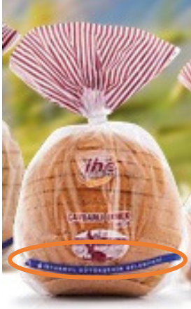
Resim 1: Halk ekmekek ürün fotoğrafı

Dolayısıyla bu şirket, devletin yani idarenin üstün kamu yararının ve kamu gücü kullanmanın avantajlarını hala taşıyabilmektedir. Arkasındaki idare gücün dolayı öyle kuvvetlidir ki marka, kendisine, özelleşmesinden 13 yıl sonra bile devlet destekli marka olarak bir uhrevi bir meselenin içerisinde “belki de vatana devlete ve dolayısıyla kamuya fayda” motivasyonu ile yer bulabilmektedir.