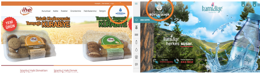
Resim 3: İHE web sayfa görüntüsü

olan ve içme suyu alanında faaliyet gösteren bir markadır. 26 Halk Ekmek ürününe olduğu şekliyle Hamidiye Su ürünlerinde de İstanbul Büyükşehir Belediyesi yazmakta ve logosu bulunmaktadır. Ayrıca her iki şirketin internet sitesinde de İstanbul Büyükşehir Belediyesi logoları bulunmaktadır. Buradan hareketle belediyelerin, inkâr etmediği gibi marka değerlerini artırmak amacıyla bilinçli şekilde kullanmaları, idare ile şirket arasındaki organik bağ çok net göstermektedir.