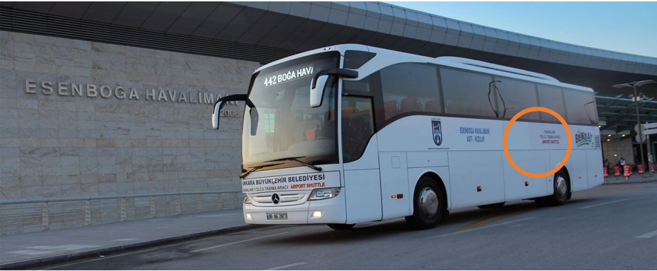
Resim 8: BelKo araç resmi