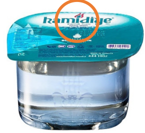
Resim 2: Hamidiye su ürün fotoğrafı

Yapı incelendiğinde belediyelerin tasarruf alanlarında olan şehrin farklı yerlerinde birçok dağıtım noktası olduğu, ayrıca “çölyak” hastaları için üretilen özel ekmeğe kadar ürün çeşitliliğine sahip olduğu görülmektedir. İstanbul Halk Ekmek A.Ş. adlı teşekkül tarafından üretilen ürünlerin tüm paketlerinde, ön yüzlerinde mavi şerit içerisinde İstanbul Büyükşehir Belediyesi yazmakta, ön ve arka yüzlerinde İstanbul Büyükşehir Belediyesi'nin 50 yıldır 25 kullandığı logo bulunmaktadır. Yine benzer bir örnek olarak Hamidiye Kaynak Suları A.Ş. verilebilir. Bu şirket de 1979 yılından itibaren İstanbul Büyükşehir Belediyesi iştiraki olarak kurulmuş