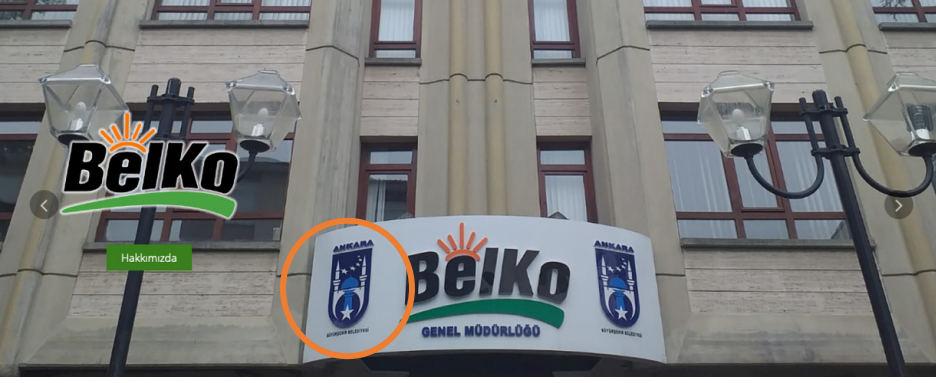
Resim 7: BelKo yönetim binası web sayfası görüntüsü