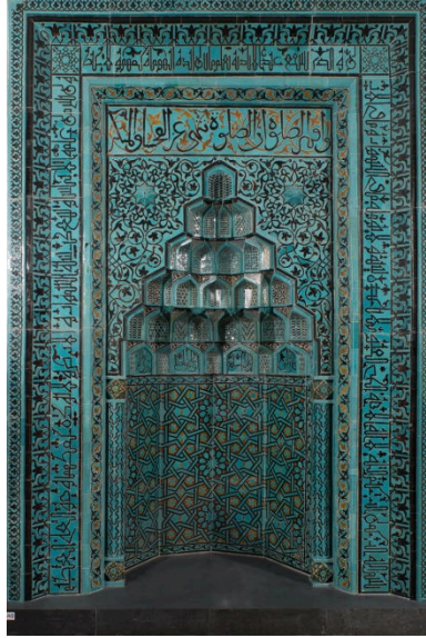
Görsel 3. Beyhekim Camiisi mihrabı

Milattan sonra 4. yüzyıldan Rönesans'a kadar olan süreçte mozaik sanatı, genellikle Hristiyan anlayışı çerçevesinde yapılan mabetlerde, inanışlarla ilgili önemli hikâyeleri betimlemek amacıyla kullanılmıştır. Bizans Sanatı örneğinde olduğu gibi Hristiyan inancı çerçevesinde yapılan mozaiklerin genelinde taş işçiliği görülürken, 7. ve 8. yüzyıldan itibaren İslam Mimarisi içerisinde yer aldığı izlenen mozaik sanatında ise genellikle sırlanmış seramik parçaların kullanıldığı görülmektedir (Richman Abdou, 2018, s. 7-8).