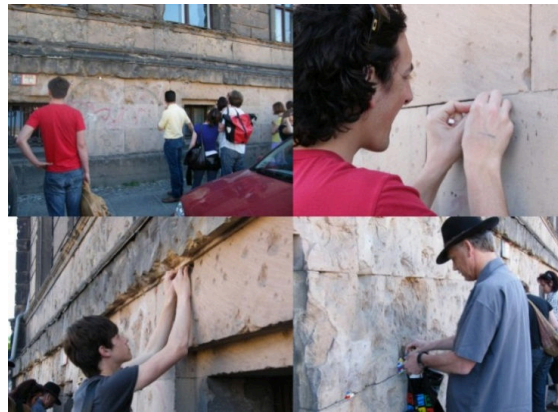
Görsel 11. Berlin'de sanatçı Vormann'a katılım sağlayan izleyiciler

Birbirine eklenen yapısı ile hayal gücünün yansımalarını oluşturmaya imkân tanıyan bir oyuncağın hemen tüm çocuklar için dikkat çekici olduğundan söz edilebilmektedir. Sanatçı Vormann da Lego parçalarını kullanarak, çevresindeki çocukların dikkatini çekmektedir. Konu paralelinde Vormann, Lego parçaları ile tahrip olmuş kent yapılarını onarıırken kendisini gören çocukların ona katılım sağlamak amacıyla yanına geldiğini ve ona yaratıcı sürecinde katkı sağladıklarını belirtmektedir (Borhes ve Tymoshchuk, 2019). Sanatçı, yaratıcı sürecinin bir parçası haline gelen, onunla birlikte kent dokusunu onaran çocuklarla etkileşimde bulunmakta ve kentin tahrip olmuş yapılarını dünyaca bilinen bir oyun aracılığıyla kolektif iş gücü içerisinde renkli bir biçimde onarmaktadır (Borhes ve Tymoshchuk, 2019).