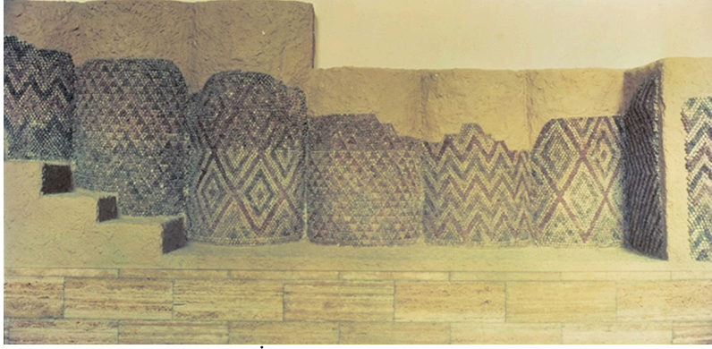
Görsel 1. Uruk şehrinde bulunan Tanrıça İnanna'ya adanmış tapınakta yer alan mozaik rekonstrüksiyonu

Bir başka kaynaktan Ödekan, mozaik sanatını dar ve geniş anlam olmak üzere iki kategoride açıklamaktadır. Geniş anlamı açısından mozaik sanatı; cam, seramik, ahşap, taş, kâğıt veya kumaş gibi çeşitli malzemelerin irili ufaklı boyutlarda bir araya getirilmesiyle oluşturulan teknik düzenlemedir. Mozaik sanatının dar anlamını ise, küçük renkli cam ve taş parçalarının harç içerisine gömülmesi tekniğiyle yapılan döşeme, duvar ve örtü betimlemeleri oluşturmaktadır (2008, s. 1102).