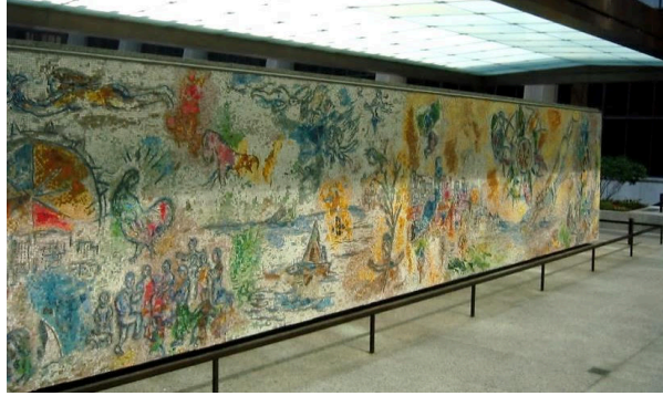
Görsel 5. Marc Chagall, Dört Mevsim / Four Seasons

Buraya kadar verilen örneklerde, mozaik sanatı için malzeme olarak pişirilmiş toprak, renkli taş ve sırlanmış seramik parçaları gibi biçimlendirilmiş malzemelerin kullanıldığı izlenmektedir. Mozaik sanatının tarihsel gelişimi içerisinde verilen bu örnekler, Görsel 4'de bir detayı yer alan doğal Shell Grotto ile zenginlik kazanmaktadır. Yerin altında bir tür labirenti anımsatan, yaklaşık 190 m2 yüzölçümüne sahip Shell Grotto'nun tüm iç yüzeyleri, duvarları ve kubbeleri ana malzemesi deniz kabukları olan mozaiklerle bezenmiştir. Shell Grotto'da yer alan mozaiklerin, mozaik sanatı tarihi içerisinde doğal malzemenin işlem görmeden olduğu gibi kullanılması açısından önemli bir örnek olduğu söylenebilmektedir. Nadeau, Shell Grotto mozaikleri için yaklaşık 4,6 milyon deniz kabuğu kullanıldığını belirtmektedir (Nadeau, 2016). 1835 yılında ortaya çıkarılan Shell Grotto'nun gerçek yaşı ile ilgili bir karbon testi yapılamamıştır. Bunun nedeninin, 19.yüzyıl sonları ve 20.yüzyıl başlarında mekânı aydınlatmada kullanılan gaz lambalarının olduğu görülmektedir. Gaz lambalarının kullanımının mekân hakkında yapılan karbon testini olumsuz etkilemesinin yanı sıra mekânda bulunan deniz kabuklarını da kirlettiği bilinmektedir (Nadeau, 2016).