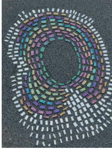
Görsel 7. Jan Vormann, Anıtsal Sokak Sanatı/Monumental Street Art

Vormann, mozaik sanatını Anıtsal Sokak Sanatı ve bir sonraki bölümde incelenecek olan Dispatchwork Projesi olarak iki farklı biçimde kategorilendirmektedir. Sanatçı St. Petersburg'da aldığı mozaik eğitiminin bir yansıması olarak çağdaş mozaikler üretirken aynı zamanda da sokak sanatı yapması nedeniyle 2012 yılından itibaren mozaiklerinin bir bölümünü Anıtsal Sokak Sanatı olarak adlandırdığını belirtmektedir (Vormann, sanatçı ile yapılan görüşme, 2020). Görsel 7 ve 8'de birer örneği izlenen Anıtsal Sokak Sanatı mozaiklerinde sanatçı, sedefli Bizassa taşları olarak bilinen ve ışık yansıması oluşturan kesilmiş parlak taşları kullanarak çeşitli tanıdık imgeleri anımsatan soyut formlar oluşturmaktadır.