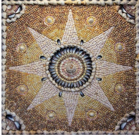
Görsel 4. Shell Grotto'da yer alan mozaiklerden bir detay

sırlanmış seramik parçaların üçgen, altıgen, dikdörtgen, daire ve baklava gibi çeşitli geometrik formlarda kesilerek alçı zemin üzerinde düzenlendiğini belirtmektedir.