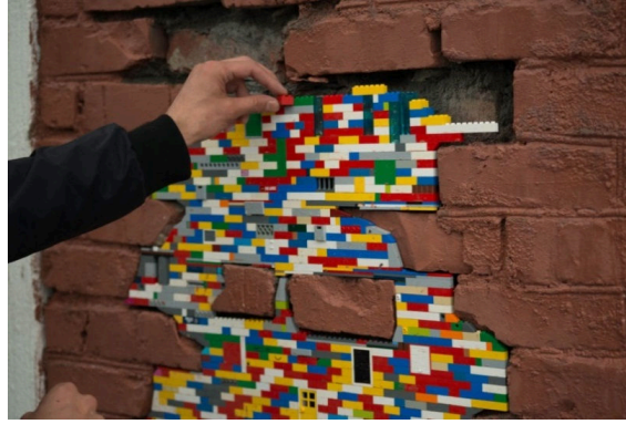
Görsel 9. Jan Vormann, Dispatchwork

Dispatchwork kelimesinin bir diğer anlamı, kelimenin dis-patchwork olarak yorumlanmasıyla meydana gelmektedir. Patchwork kelimesinin Türkçe karşılığı çeşitli kumaşların bir araya gelmesiyle oluşan yama işi ya da yama sanatı olarak kullanılmaktadır. Bununla birlikte İngilizce'de "dis" takısının önüne geldiği kelimeye farklı anlamlar kattığı bilinmektedir. Kelimelerin önüne gelen bu takı, olumsuzluk ifade etmekte; bir eylemin veya durumun tersine çevrilmesini veya yokluğunu göstermekte; ayırma, ayrılma, çıkarma alt anlamları birlikteliğinde bir şeyin sökülmesi anlamına gelmekte; hoş olmayan veya çekici olmayan bir durumun bütününe veya derecesini belirtmektedir (Lexico, 2020). Kelime önüne gelen "dis-" takısının verdiği anlamlar ve Görsel 9'da bir örneği izlenen Vormann'ın Dispatchwork Projesi'nin Türkçe'de sökülebilir yama sanatı olarak da yorumlanabileceği düşünülmektedir.