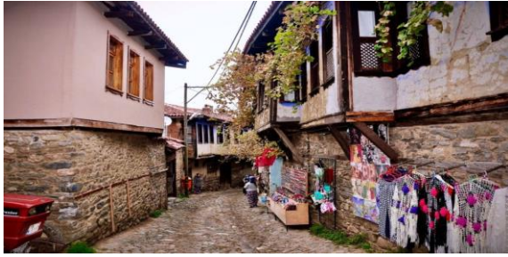
Şekil 1. Cumalıkızık köyü sokakları, Fotograf: Betül Sezen.

Köyde kışlar genel olarak çok yağışlı, yazlar ise kuraklığa sebep olmayacak derecede yağışlı geçer. Köye ulaşımın kolay olması için belediye birçok imkân geliştirmiştir. Cumalıkızık'a, Bursa Santral garajdan minibüs ve belediye otobüsleri aracılığıyla yaklaşık yarım saatte ulaşılabilir. Yapımı tamamlanan metro durağı köyün 3 km altında Ankara asfaltı üzerindedir. Durağın ismi Cumalıkızık olup turistlere büyük kolaylık sağlamıştır. Cumalıkızık 1981 yılında kentsel ve doğal sit alanı ilan edilmiş olup 2014 yılında dünya mirası listesine alınmıştır. Osmanlı tarihini yansıtan bir yapısı bulunmaktadır ve günümüze kadar doğal yapısını bozmadan gelen Osmanlı'nın en eski köyü olma özelliğine sahiptir (TC Kültür ve Turizm Bakanlığı, 2020). Cumalıkızık'la ilgili örnek görüntüler Şekil 1 ve Şekil 2'de verilmiştir.