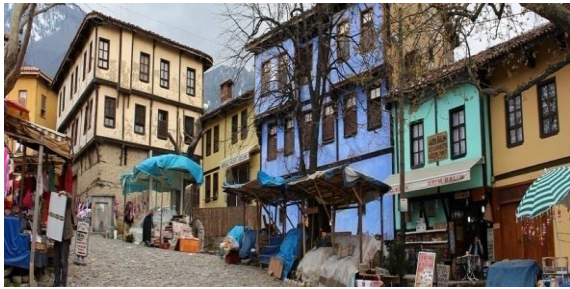
Şekil 2. Cumalıkızık köyünden bir kesit.