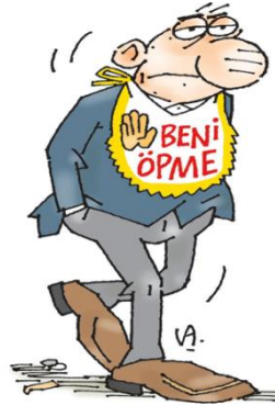
Grsel 1 (URL-17).

ğın sađlıđını koruma ihtiyacı yatan “beni pme” ifadesi yer almaktadır. Korona virsn ortaya ıkıřının ardından yapılan alıřmalar virsn přme, hapřırma, ksrme gibi durumlarda oluřan su damlacıkları nedeniyle bulařıcılıđının arttıđını, daha fazla kiřiye yayıldıđını gstermektedir. Virsn yayıldıđı bu dnemlerde yetiřkin bir insanın “beni pme” sznn ardında da kendisini hastalıktan koruma dřncesi yer almaktadır. Ancak bebeklere ait olan nlđn yetiřkin bir insana giydirilmesi meselenin mi-zahi ynn aıđa ıkarmaktadır.