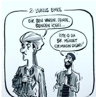
Görsel 5 (URL-21).

Panik halinde, kaygının seviyesinin artış göstermesinin yanı sıra durumlar ve olaylar karşısında gülerek tepki vermek de son derece normaldir. Mizah yalnızca mutluluk, neşe, hoşça gitme, şaşkınlığın değil, aynı zamanda, bastırılan korku, endişe, tedirginlik, kaygı vb. duyguların dışı vuruşu olarak da belirebilmekte ve bu yönüyle “gerilimi azaltma” işlevini de yerine getirebilmektedir (Keskin, 2020: 508-509). Salgın döneminde panik halinin, gerilimin en yüksek seviyeye ulaştığı dönemler sokağa çıkma yasaklarının başladığı dönem dönem belirli şehirlerde, dönem dönem ülkenin tamamında büyük, küçük, işçi, memur, kadın, erkek ayırt etmeden herkesin evlerine kapandığı günlerdir. Bu günlerin hemen öncesinde yaşanan kargaşa hali, okuduğumuz ve izlediğimiz haberler paniğin ne kadar yüksek seviyelere çıktığını göstermektedir. Ancak en gergin zamanlarda da mizahtan faydalanılarak korona virüsüne karşı üstünlük sağlanmış, bireylerin gerginliği azaltılmıştır.