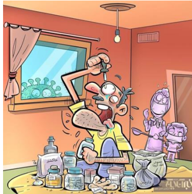
Görsel 2 (URL-18).

Morreall, ciddi görülen bir yapının mizaha nasıl dönüştüğünü anlatırken daha çok uyumsuzluk üzerinde durmuş ve bu uyumsuzlukları çeşitli başlıklar altında incelemiştir. Morreall’in “bilgisizlik ya da cahillik” diye sınıflandırdığı (Güvenç, 2011) mizahı ortaya çıkaran yön geleneksel sağaltma karikatüründe kendisinin gösterir. Salgının ilk duyulduğu andan itibaren korunma ve arınma amacıyla geleneksel tıbbı başvuran halk bunu bilinçsizce yapar. Dünya Sağlık Örgütü’nün bazı bitkisel ilaçlar ve geleneksel tıbbın korona virüs belirtilerini hafiflettiğini kabul etmesine ancak bu maddelerin hastalığı önlediği ya da iyileştirdiğine dair hiçbir kanıt bulunmadığını belirtmesine rağmen soğan, sarımsak, sirke, zencefil, zerdeçal, limon, tarçın ile çeşitli otların kullanımı olağan şartlara oranla üst düzeye çıkar. Bu ürünlerin kullanımını öneren, destekleyen onlarca paylaşım yapılır. Bununla kalmaz, kolonya içen, Arap sabunu tüketen vatandaşların sosyal medyada ve televizyon programlarında haberleri yapılır. İşte bilgisizlikten doğan mizah kendisini burada gösterir. Geleneksel sağaltma yöntemleri faydalı olmasına rağmen her şeyin belirli bir dozda ve belirli bir yöntemle gerçekleştirilmesi gerekmektedir. Aksi halde aşağıdaki karikatüre de yansıyan “çıldırılmış birey” gülmececi baş gösterir.