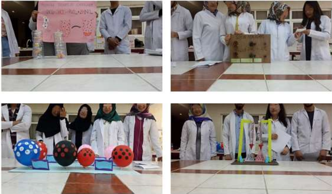
Şekil 1. Yedi ilke uygulamasında öğrenci sunumları

4(asında geri dönüt verilmesi)'ün sınıf dışında gerçekleştirilmesinde öğrencilerin yürüttükleri projeler ve araştırma dâhilindeki kimya konuları hakkında sormak istedikleri sorular Edmodo uygulaması aracılığı ile araştırmacıya ulaştırılmıştır. Araştırmacı öğrencilerin sorularını aynı gün içinde yanıtlayarak geri bildirimde bulunmuştur. İlke 5'in uygulamaya geçirilmesi yukarıda değinilen projelerin yürütülmesi ve sunulması için bir tarih belirlenmiş ve öğrencilerin çalışmaları haftalık olarak takip edilerek belirlenen tarihte tamamlamaları sağlanmıştır. İlke 6'nın uygulamaya dahil edilmesi, öğrencilere proje konusu olarak verilen konularda yaptıkları çalışmalarla ön plana çıkan bilim insanlarının hayatlarını araştırarak sınıfta grupça sunmaları sağlanmıştır. Böylece öğrencilerin bilim insanlarını yakından tanıyarak kendi beklentilerine ulaşmaları için ne yapmaları gerektiğini görmeleri amaçlanmıştır. İlke 7, öğrencilerin projelerini istedikleri şekilde planlamaları yürütmeleri ve projelerinin sunumunda istedikleri materyalleri kullanmaları konusunda serbest bırakılmalarıyla sağlanmaya çalışılmıştır.