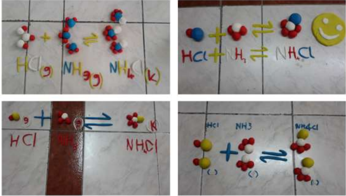
Şekil 32. Kimyasal denge konusu ile ilgili model çalışmaları

uygulanmıştır. Bu grupta OYU'nun uygulama aşaması tamamlandıktan sonra öğrencilerden, yapılan deneydeki durumları/olayları(kimyasal ve fiziksel reaksiyonlar) oyun hamurları ve top-çubuk modelleriyle tanecik boyutta modellemeleri istenmiştir. Model çalışmalarına bir örnek Şekil 3'te verilmiştir. Araştırmacı bu noktada, yapılan model çalışmaları ile gerçek durumlar arasındaki farkların neler olduğunu tüm grupları dolaşarak ifade etmiştir. Modellerin yanlış anlaşılmasından dolayı oluşabilecek çeşitli kavram yanılgıları önlenmeye çalışılmıştır. Araştırmacı, model çalışmalarını tamamlayan grupları tek tek dolaşarak, yapılan modelle ilgili değerlendirme yapmış eksiklikler varsa giderilmesi konusunda gruplara geri bildirimde bulunmuş ve anlaşılmayan kısımlarla ilgili açıklamalar yaparak uygulama tamamlanmıştır.