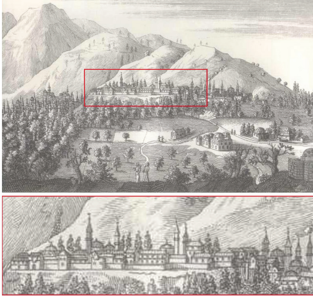
Ek 3: 1701 tarihinde Bursa’yı ziyaret eden Tournefort’un gravüründe Hisar Bölgesi kuzey yamacında yapılaşma ( Gravürlerle Türkiye Anadolu 1 , yay. Mustafa Sevim, T.C. Kültür Bakanlığı, Ankara 2002).