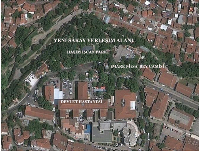
Ek 5: Yeni Saray Yerleşim alanını gösteren uydu fotoğrafı