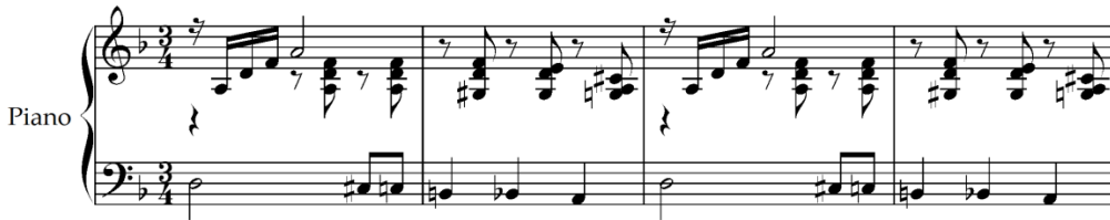
Şekil 10. I. Albeniz, Cantos de Espana op.232, Cordoba, ölçü 53-56 [34]

Albeniz'in Cantos de Espana op.232 eseri Prelude, Orientale, Sous le palmier, Cordoba, Seguidillas başlıklarından oluşmaktadır. Eser 1892 yılında yazılmış ve 1898 yılında revize edilmiştir. Cordoba bölümünde bas partisi Re-La aralığında inici kromatik bir ilerleyiş yapmaktadır. Re dizisinin 6. ve 7. dereceleri şekil 2'de gösterildiği gibi hem tiz hem de doğal olarak kullanılmıştır. Aynı yapı 186. ölçüde de gelmektedir. Eser 1898 yılında yazılmıştır ve 3/4 ölçü sayısındadır.