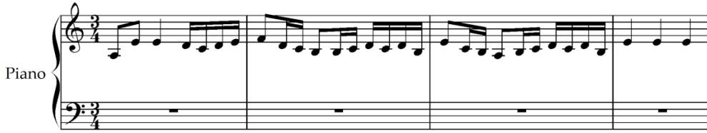
Şekil 9. I. Albéniz, Recuerdos de Viaje Op.71, No.4, En la Alhambra, ölçü 1-4 [33] (Figure 9. I. Albéniz, Recuerdos de Viaje Op.71, No.4, En la Alhambra, mm. 1-4)

Albeniz'in 1887 yılında yazılan Recuerdos de Viaje Op.71 çalışmasının En la Alhambra bölümü La ekseninde bir tema ile başlamaktadır. 3/4 ölçü yapısındadır. Tematik yapı La-Fa aralığındaki altı notadan oluşmaktadır.