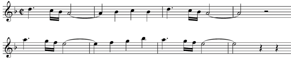
Şekil 19. A. M. Gomez, La Madruga , ölçü 43-50 [8] (Figure 19. A. M. Gomez, La Madruga , mm. 43-50)

La Madruga çalışması, 1987 yılında Gomez'in Paskalya için yazdığı dinsel tören esnasında çalınan marştır. Son derece basit bir armoni ve melodi sunmaktadır. Her yıl bahar mevsimi ile beraber Sevilla şehri en köklü tarihsel şenliklerinden birine ve kentin en büyük kültürel geleneği olan Paskalya'ya hazırlanmaktadır. Paskalya'nın tarihi Sevilla halkının hislerinin, fikirlerinin ve hatta sokaklarının tarihidir [8]. La Madruga çalışmasının giriş kısmından sonra 43. ölçüde başlayan tematik motif incici tetrakord dizisi ile başlamaktadır. Re-Do-Si b -La. 47. ölçüde devam eden tematik ilerleyiş La-Sol-Fa-Mi ses dizisinden oluşmaktadır. Sebare ölçü yapısındadır.