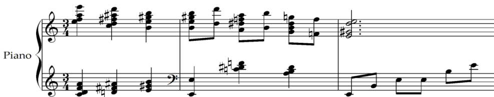
Şekil 14. J. Turina, Sevilla op.2, Bajo los Naranjos, ölçü 1-3 [36]

Endülüs'ün Sevilla ilinde doğan ve o bölgenin yerlisi olan Turina'nın müzikal stilini Endülüs başta olmak üzere İspanya'nın bölgesel özellikleri ile Claude Debussy'nin (1862-1918) müzikal yenilikleri etkilemiştir. Bu etkilerin melodi, armoni, ritim, doku ve form olarak piyano müziğinde bulunması muhtemeldir. Besteci 1907'de Paris'te Albeniz ve Falla ile buluşmasının ardından kendisini tamamen milliyetçi müzik yazmaya adanmış, müziğindeki Endülüs öğelerinden gelen İspanyol karakteri ve milliyetçi havası belirgin şekilde ortaya çıkmıştır [23]. Sevilla op.2 Bajo los Naranjos çalışması 1908 yılında yazılmıştır ve 3/4 ölçü yapısındadır. Eserin giriş kısmında 2. ölçüde üst partide La-Sol-Fa-Mi seslerinden oluşan ve akorlar ile desteklenen inici bir tetrakord ses dizisi bulunmaktadır. Aynı yapı 6. ölçüde de gelmektedir.