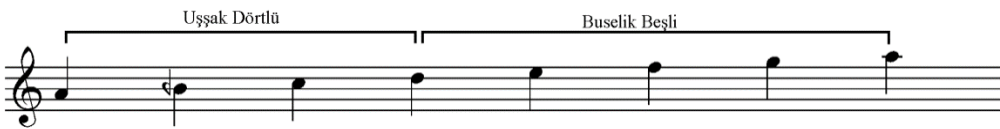
Şekil 3. Bayati makam dizisi [2] (Figure 3. Scale of bayati maqam)

Endülüs'ün popüler müziği Arap ve Avrupa müziklerinin bir sentezini temsil etmektedir. Arap müziği farklı melodik mod sistemlerine ve ritmik yapıya dayanmaktadır. Bu farklı modal sistemlerin sanat müziği, halk müziği, dini müzik veya popüler müzik olup olmadığı ile ilgilidir. Melodiler makamlardan oluşur ve herhangi bir makam melodik özelliklerin zenginliğini belirleyebilir. Bu durum hangi notaların vurgulanması gerektiği, tetrakord ses dizilerinin kullanımı, bemol ve diyezlerin ifade tarzına uygun kullanımı, diğer makamlara yapılacak modülasyonlar ve melodik motifler hakkında fikirler içerir. Ayrıca birçok makam onları ayırt etmeye yarayan karakteristik melodik ilerleyişe (seyir) sahiptir. Endülüs dizisi üzerindeki frigyan formunda 2., 3., 6. ve 7. derecelerin doğal ya da yarım ses tiz kullanılmasıyla ortaya çıkan varyasyonlar bu dizinin iki Arap makamı bayati ve hicaz ile yakından ilişkili olduğunu göstermektedir [16 ve 15]. Bayati makamı alt tetrakord dizisinde La sesinde uşak dörtlüsü, üst pentakord dizide ise Re perdesi üzerinde buselik beşlisinin birleşmesinden meydana gelmiştir. Bu makam inici-çıkıcı seyir (ilerleyiş) özelliği göstermektedir. Re sesi (neva) veya civarından seyre başlamaktadır [2 ve 18].