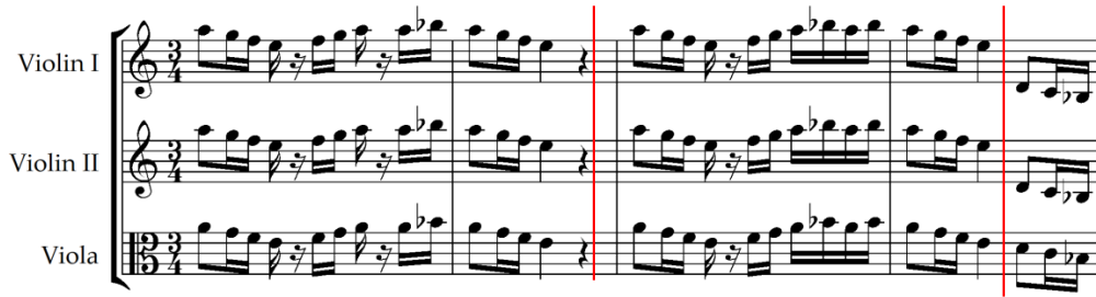
Şekil 23. J. Rodrigo, Concierto para una Fiesta , Allegro moderato , ölçü 1-4 [41]

jondo 1 'nin melodik süslemelerini, folklorik öğeleri ve gitarın efektif eşlik özelliklerini çağdaş kompozisyon teknikleri ile birleştirerek 20. yüzyıl İspanyol müziğinin karakteristik stilini oluşturmuştur [26]. Rodrigo'nun 1982'de bestelediği gitar konçertosu Concierto para una Fiesta eserinde ilk bölüm bestecinin doğduğu şehir olan Valensiya'dan temalar içermektedir. İkinci bölüm lirik ifadeden daha ziyade ritmik etkisi ile ön plandadır. Bu bölüm 6/8 ve 5/8'lik ölçü sayısı değişimleriyle canlandırılmıştır. Son bölüm ( Allegro moderato ) Sevilla bölgesine ait folklorik şarkı ve dans türü olan Sevillanas 'tan ilham alan ritimler ve melodiler ile fiesta havasını ortaya çıkarmaktadır [6]. Concierto para una Fiesta 'nin son bölümü ( Allegro moderato ) 3/4 ölçü sayısında yazılmıştır. La-Sol-Fa-Mi inici tetrakord sesleri üzerine kurulu süslemeli tematik motiften oluşmaktadır. Beş notadan oluşan ses aralığındadır. Falla'nın En los Jardines de la Sierra de Córdoba eserindeki tematik motif ve Ponce'nin Concierto del Sur eserinin birinci bölümündeki ( Allegro moderato ) tematik motif ile büyük benzerlik göstermektedir. Melodik yapı La sesi üzerinde frigyan mod kullanılarak oluşturulmuştur.