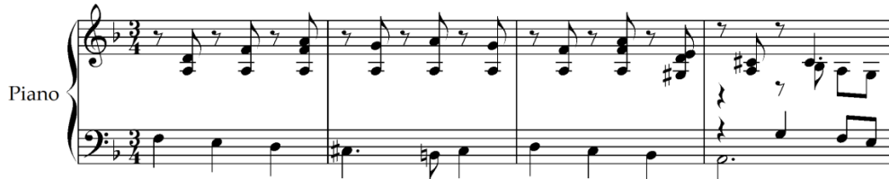
Şekil 11. I. Albeniz, Cantos de Espana op.232, Cordoba, ölçü 61-64 [34]

Aynı bölümün 63. ölçüsünde bas partisinde Re-Do-Si b -La seslerinden oluşan inici bir tetrakord yürüyüş bulunmaktadır.