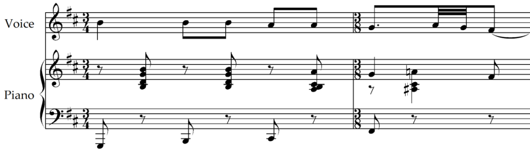
Şekil 18. M. de Falla, Siete Canciones Populares Espanoles , El Pano Moruno, ölçü: 36-37 [38] (Figure 18. M. de Falla, Siete Canciones Populares Espanoles , El Pano Moruno, mm. 36-37)

Aynı çalışmada birinci temanın sonunda vokal partisinde Si-La-Sol-Fa# seslerinden oluşan kadans bulunmaktadır. İnci tetrakord yürüyüş Endülüs'ün karakteristik özelliğini sunuyor.