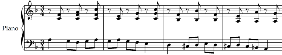
Şekil 12. I. Albeniz, Cantos de Espana, op.232, Cordoba, ölçü 85-88 [34]

Aynı bölümün 85 ve 86. ölçüsünde bas partisinde La-Sol-Fa-Mi, 87 ve 88. ölçülerde Re-Do#-Si-La seslerinden oluşan motifler bulunmaktadır.