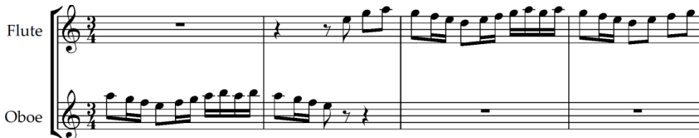
Şekil 22. M. Ponce, Concierto del Sur, Allegro moderato, ölçü 2-5 [40] (Figure 22. M. Ponce, Concierto del Sur, Allegro moderato, mm. 2-5)

Segovia'nın önerisi ve isteği ile yazılan gitar konçertosu Concierto del Sur Ponce tarafından 1941 yılında tamamlanmıştır. Eser bestecinin en iyi bilinen konçertosu ve gitar repertuarındaki en önemli çalışmasıdır. Eserin müzikal stili ve dili Segovia'nın yoğun isteği üzerine İspanyol karakterindedir. 1. bölüm Endülüs'ün ritmik ve melodik ambiyansını yansıtır. 2. bölüme Granada'nın Arap dokusu eşlik eder. 3. bölüm de ise Sevilla'nın neşesi ve gösterişi hâkimdir [17 ve 30]. Şekil 20'de görüldüğü gibi Ponce'nin kullandığı tematik motif Falla'nın En los Jardines de la Sierra de Cordoba çalışmasındaki tematik motif ile büyük benzerlik göstermektedir. Eser 3/4'lük ölçü sayısında yazılmıştır. Ritmik karakter olarak da şekil 21 ile aynıdır. Ses malzemesi olarak Endülüs'ün en belirgin müzikal özelliği olan La-Sol-Fa-Mi inisi tetrakord sesleri üzerine besteci süslemeli tematik motifi oluşturmuştur. Bu tematik motif de altı nota ile sınırlıdır.