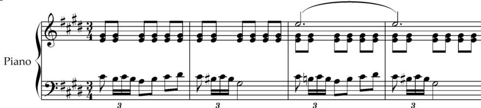
Şekil 8. I. Albeniz, Suite Espanola op. 47, Cadiz, ölçü 45-48 [32] (Figure 8. I. Albeniz, Suite Espanola op. 47, Cadiz, mm. 45-48)

Albeniz'in 1887 yılında yazılan Recuerdos de Viaje Op.71 çalışmasının En la Alhambra bölümü La ekseninde bir tema ile başlamaktadır. 3/4 ölçü yapısındadır. Tematik yapı La-Fa aralığındaki altı notadan oluşmaktadır.