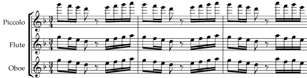
Şekil 20. M. de Falla, Noches en las Jardines de Espana , En los Jardines de la Cierra de Cordoba , ölçü 1-3 [39] (Figure 20. M. de Falla, Noches en las Jardines de Espana , En los Jardines de la Cierra de Cordoba , mm. 1-3)

Şekil 20 ve 21'de görüldüğü gibi besteci ilk ölçüde başlayan tematik motifi Sol-Fa-Mi-Re, ölçü 9-12'de ise La-Sol-Fa-Mi inici tetrakord ses dizisi üzerine kurmuştur. Bu özellik Şekil 10, 11, 12, 13, 14, 15, 16, 17 ve 18'de örnekleri verilen İspanyol bestecilerin eserlerinde görülebilmektedir. Tetrakord dizi üzerine inici-çıkıcı melodik bir ilerleyişin olması bayati ve hicaz makamlarının seyir özellikleri ile benzerlik göstermektedir. Aynı zamanda Şekil 21'deki tematik motif altı notayı geçmeyen bir ses aralığına sahiptir. Şekil 21'deki ritmik karakter şekil 9'da Albéniz'in Recuerdos de viaje Op. 71 No:4 En la Alhambra eserindeki ritmik karakter ile benzerlik göstermektedir.