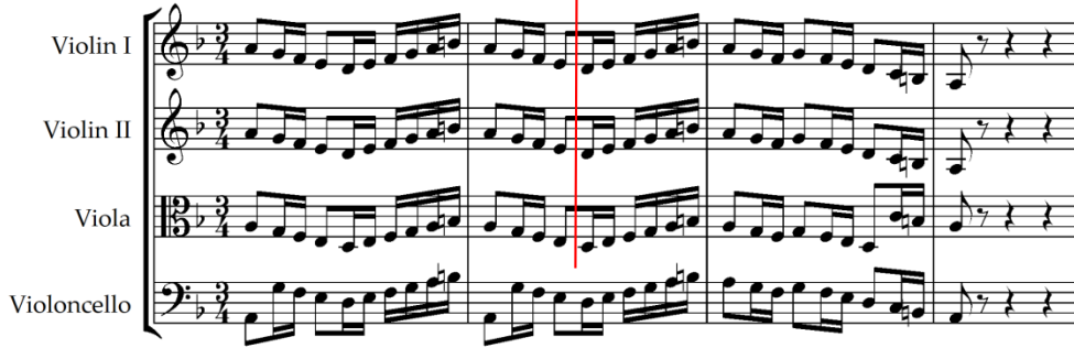
Şekil 21. M. de Falla, Noches en las Jardines de Espana, En los Jardines de la Cierra de Cordoba, ölçü 9-12 [39] (Figure 21. M. de Falla, Noches en las Jardines de Espana, En los Jardines de la Cierra de Cordoba, mm. 9-12)

Meksikalı besteci Manuel Ponce'nin (1882-1948) müziğini yaşamı boyunca şekillendiren üç ana etki vardır. Birincisi büyüdüğü yer olan Meksika'da yaygınlaşan Avrupalı romantik müziktir. İkincisi halk müziğine olan ilgisidir. Bu ilgi sadece Meksika müzikal milliyetçiliğinin öncüsü olarak kalmamış, aynı zamanda Küba ve İspanyol müziğinden çok sayıda müzikal unsurları da çalışmalarına katmıştır. Üçüncü olarak ise sekiz yıl kaldığı Paris'te modern müzikal eğilimleri yakından benimsemesi ve bunun sonucu olarak neoklasizm ile Fransız empresyonizmin müzikal stili üzerinde derin etki bırakmasıdır. Ponce'nin Paris'teyken yazmış olduğu eserler İspanyol müziğinin besteci üzerindeki artan etkisini de sergilemektedir. Bu sırada İspanyol gitarist Andres Segovia (1893-1987) ile yakın dostluğu Ponce'nin İspanyol müziği ile daha derin bir bağ kurmasını sağlamıştır [7].