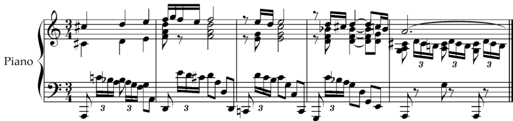
Şekil 16. E. Granados, Goyesca No:3, El Fandango de Candil, ölçü 9-13 [37]

Özgün doğaçlama yeteneğine sahip başarılı bir piyanist olarak Granados, Romantik Dönem'in müzikal fikirlerini İspanyol folklorik materyaller ile birleştirmiştir. Goyescas (1911) çalışması, bestecinin deneyim ve sanatının doruk noktası temsil etmektedir. İspanyol ressam ve gravür sanatçısı Francisco Goya'nın (1746-1828) eserleri, İspanyol dans ve şarkıları, gitar ve kastanyetin müzikal ambiyansı Goyescas çalışmasının yapı taşlarını oluşturmuştur. Çalışma iki seri olarak yayımlanmış ve altı alt başlıktan oluşmaktadır [5]. Süitte Endülüs havasına en çok sahip olan bölüm El Fandango de Candil çalışmasıdır. 3/4'lük ölçü sayısında yazılmıştır. Kent'e [11] göre; El Fandango de Candil çalışması La üzerinde frigyan mod ile re minör tonalitesi arasında bir yapı sunmaktadır. 9. ölçüden itibaren üst partide başlayan temanın bitişinde (kadans) inici bir tetrakord (Re-Do-Si b -La) ses dizisi bulunmaktadır. Aynı tema 112. ölçüde tekrar gelmektedir.