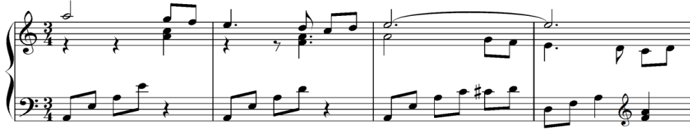
Şekil 15. J. Turina, Sevilla op.2, Bajo los Naranjos, ölçü 25-28 [36] (Figure 15. J. Turina, Sevilla op.2, Bajo los Naranjos, mm. 25-28)

Aynı çalışmanın 25. ölçüsünde tema başlamaktadır. Tematik motif La-Sol-Fa-Mi seslerinden oluşan inici bir tetrakord ses dizisi ile başlamaktadır. Güney İspanya'nın en önemli ses özelliklerinden biri olan bu yapıyı besteci eser boyunca hissettirmektedir. Tematik yapıyı oluşturan ses malzemesi ise Endülüs'ün müzikal özelliklerinden biri olan 6 nota ile sınırlı bırakılmıştır.