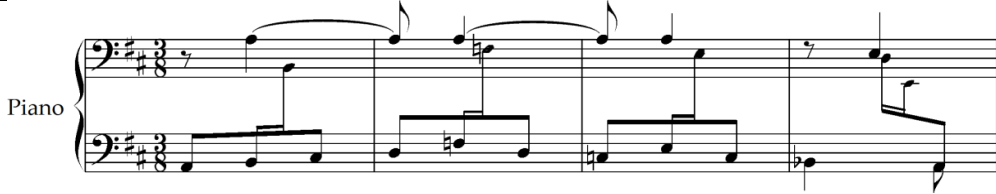
Şekil 17. M. de Falla, Siete Canciones Populares Espanoles , El Pano Moruno, ölçü: 1-4 [38] (Figure 17. M. de Falla, Siete Canciones Populares Espanoles , El Pano Moruno, mm. 1-4)

Aynı çalışmada birinci temanın sonunda vokal partisinde Si-La-Sol-Fa# seslerinden oluşan kadans bulunmaktadır. İnci tetrakord yürüyüş Endülüs'ün karakteristik özelliğini sunuyor.