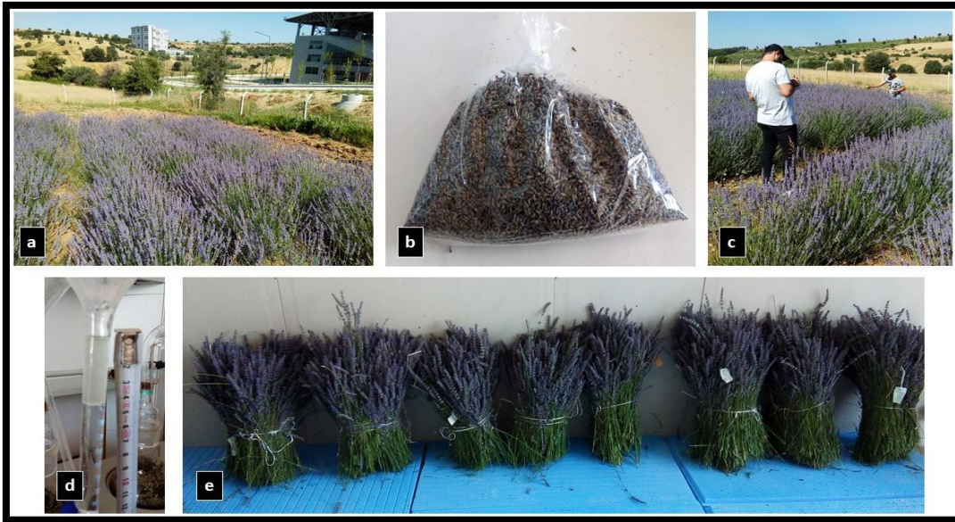
Şekil 2: a-c) denemenin 2. yılına (2020) ait görüntüler, b-e) drog çiçek, hasat edilen taze herba, d) uçucu yağın elde edilmesi. Figure 2: a-c) Views of the 2nd year (2020) of the study, b-e) harvested drug flowers and fresh herbs, d) obtaining essential oil.

Atalay (2008), yaptığı çalışmasında çiçek boyu uzunluğunun 17.64–20.57 cm arasında değiştiğini belirlemiştir. Ceylan (1996), çiçek başağı uzunluğunun 16-20 cm arasında değiştiğini bildirmiştir. Bu çalışmada