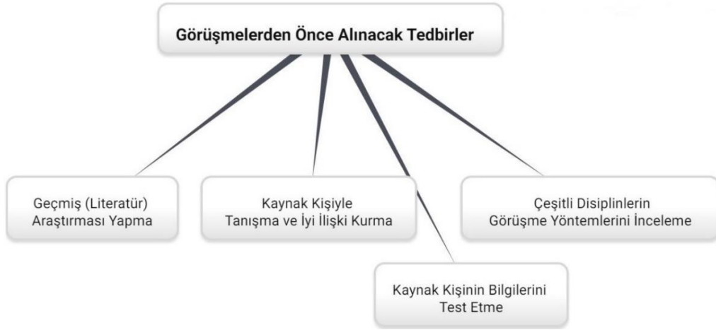
Şekil 1. Görüşme Öncesi Alınacak Tedbirler

Şekil 1’de yer verilen ikinci önlem, görüşmeden önce kaynak kişiyle bir araya gelerek görüşmenin yer ve zamanının belirlenmesinin yanı sıra çalışmanın amacı, aşamaları ve kaynak kişiden neler beklendiğinin ayrıntılı olarak anlatılmasıdır (Morrissey, 2006; Oelofse, 2011). Bu ziyaretle kurulacak muhtemel iyi bir ilişki görüşmeye de olumlu yansır (Yow, 2014). Bunun için araştırmacı, öncelikle karşısındaki kişiyi bir birey olarak kabul edip ona karşı ilgi ve saygı göstererek, esnek davranarak, görüşlerine anlayış ve sempatiyle yaklaşarak konuşmalıdır (Thompson ve Bornat, 2017). Bir sözlü tarih görüşmesinde kurulacak iyi bir ilişki, kaynak kişinin anılarını samimi şekilde anlatmasını yani doğruluğunu artırır. Buna karşın iyi ilişkinin, görüşmenin doğruluğuna büyük katkı yapacağı gibi, fazla yakınlığın araştırmacıları önyargıya düşürebileceğini de unutmamaları gerekmektedir (Cutler III, 1996).