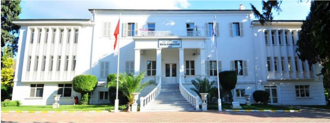
Şekil 1. C. Whitall Konağı, Bornova (Kaynak: Ege Üniversitesi; 2020).