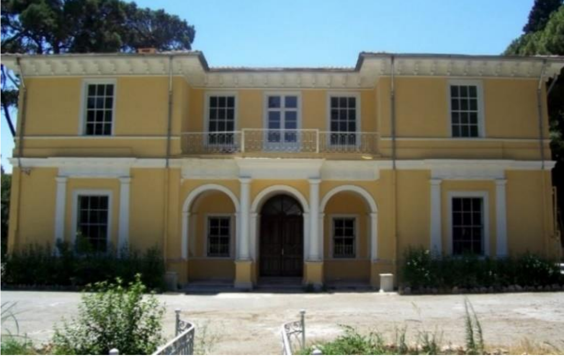
Şekil 2. Baltazzi Konağı, Buca, 2010 (Kaynak: Kişisel arşiv).

Abdülaziz'den sonra gelen padişahlardan, V. Murad (hükümdarlığı: 1876) ve VI. Mehmed Vahideddin (hükümdarlığı: 1918-1922) hariç hepsi yurtiçi gezilerine devam etmiş ancak İzmir'e uğramamışlardır (Mercan, 2017, 472).