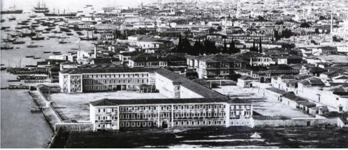
Şekil 4. 1871 tarihinden önceki bir fotoğrafta İzmir Sarıklısa. Güneyden görünüş (Kaynak: Mimarlar Odası İzmir Şubesi Arşivi, 2019).

denilerek bir keşif çıkarılmış, yapılması gereken imalatlar, imalatın kaç gün süreceği (veya sürdüğü), ne kadar malzeme gerektiği, malzemenin birim ve toplam fiyatları ayrıntılı biçimde listelenerek ser-askeriye makamına iletilmiştir.