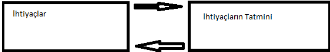
Grafik 1: Kıt kaynaklar, sonsuz ihtiyaçların karşılanması arayışları ve yeni ihtiyaçların doğuşu

Grafik 1’de görüldüğü gibi bireylerin mevcut ihtiyaçları tatmin oldukça yeni ihtiyaçlar ortaya çıkmaktadır. Bu döngüsel akım ihtiyaçların sonsuzluğu fenomeni olarak tanımlanır. Böylece mevcut kaynaklar hiçbir zaman ihtiyaçların nihai olarak tatminini sağlamayacaktır. Bu süreçte ihtiyaçların karşılanmasını sağlayan mal ve hizmetlerin temini ulusal ve uluslararası boyutları bulunmaktadır. Özellikle hizmetlerin yerine getirilmesi bazında önemli oranda insan gücüne ihtiyaç duyulmaktadır. Bu bağlamda Almanya gibi batı Avrupa ülkeleri her ne kadar her türlü göç ve mültecilere karşı sıkı politikalar izliyor olsalar da ülkelerinin ihtiyaç duyduğu uzman işgücüne (Schlüsselkraft) karşı teşvik edici programlar devreye koymaktadırlar (Welt, 2017). Bu çerçevede demografik hareketleri sadece göç ve mülteci bazlı ele almak yeterli bir yaklaşım olmamaktadır. Bunun yerine demografik değişim ve dönüşümleri sosyoekonomik döngüsel akımın kıt kaynaklar ile sonsuz ihtiyaçları dengeleme arayışları sonucu zuhur bulması olarak değerlendirmek daha kapsamlı bir yaklaşım olacaktır.