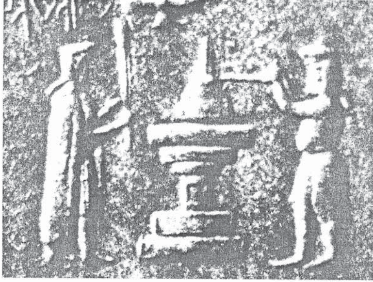
Resim 8 Persepolis'ten mühür. Sunu yapan ateş kültü magları, M.Ö. 6.-5. yy. (H. V. Gall, BaghMitt 19/1988, Taf. 33 b)