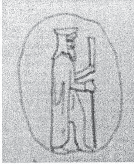
Resim 6 Daskyleion (Ergili), Mag baskılı bulla