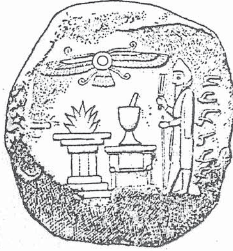
Resim 9 Mag ve sunak (baskı), Persepolis, M.Ö. 6.-5. yy, (A. Sh. Shahbazi, AMI 13/1980, s. 117)