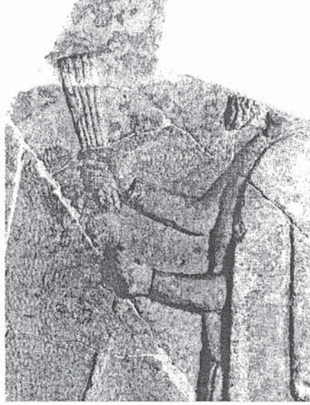
Resim 4 Daskyleion (Ergili) Kabartması, Greko-Pers Devri, M.Ö. 5 yy., Mag sunu yaparken (İAM Env. 5391 T)