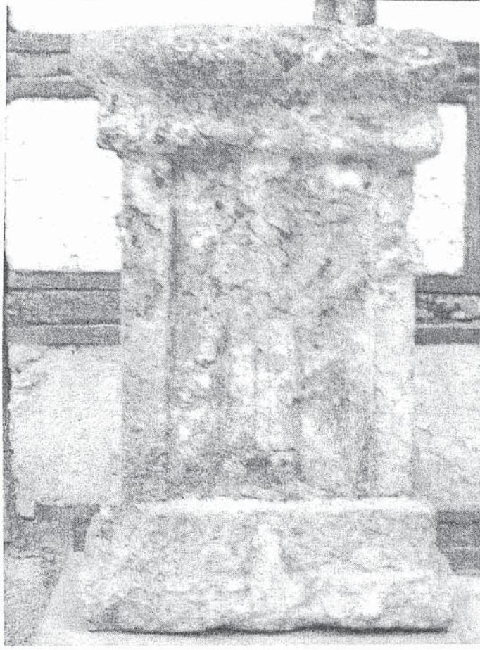
Resim 1-3 Bünyan sunağının üç yüzü. Greko-Pers deveri (Anadolu Medeniyetleri Müzesi)