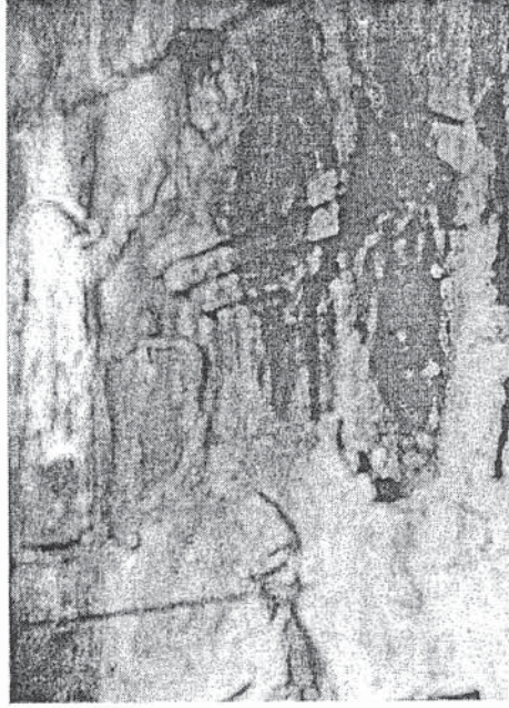
Resim 10 Maglar ritüel sahnesinde. Kızkapan kaya mezarı kabartması, İran