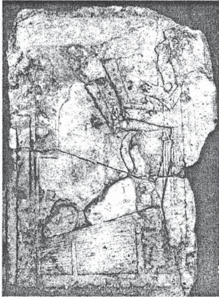
Resim 5 Daskyleion (Ergili) Kabartması, Greko-Pers Devri, M.Ö. 5. yüzyılın 2. yarısı. Maglar Tapınak Önünüde (İAM Env. 2361 T)