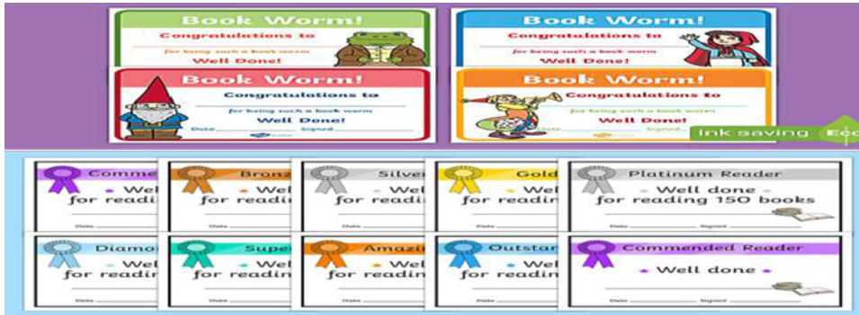
Şekil 4: Okuma Becerisine Yönelik Sertifika ve Ödül Örnekleri

Her haftanın son okul günü tüm okulun katılımıyla gerçekleşen törenlerde verilen, sınıf öğretmeni, müdür ve özel başarı ödülleri, sertifikalar, öğrencinin diğer ders ve beceri alanlarında gösterdikleri çaba ve ürün için olabildiği gibi okuma becerisine yönelik olarak da düzenlenebilmektedir.