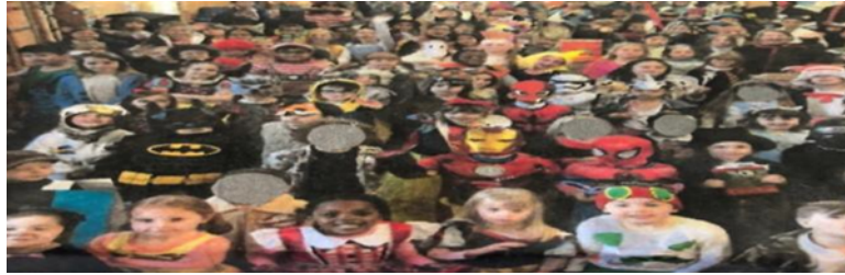
Şekil 5: Dünya Kitap Günü Kutlaması

Bu gün aynı zamanda okullarda bir şenlik havasında kutlanmakta, çocuklar severek okudukları kitap karakterlerinin kılığına girerek eğlenmektedir. Okulların tercihine göre yerel kütüphanelere ya da kitapçılara geziler, ünlü kitap karakterlerinden oluşan sergiler ya da kitap temalı farklı etkinlikler de düzenlenilmektedir. Ayrıca, çocuklardan gönüllük esasına göre toplanan bağışlar Book Aid International gibi yardım vakıfları aracılığıyla diğer ülkelerdeki çocuklara kitap göndermek için de kullanılmaktadır ("World Book Day", t.y.)