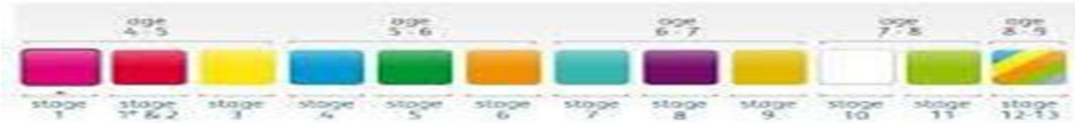
Şekil 1: İngiltere’deki Okullarda Kullanılan Renkli Kitap Dizisi

İngiltere’deki tüm ilkokullarda çocukların yaş seviyesine ve okuma becerilerine uygun kitaplar, Oxford Reading Tree ve Book Band adı verilen renklerle derecelendirilmiş kitap dizisi kullanılarak seçilmektedir. Buna göre 4-5 yaşındaki çocuklar pembe renkli birinci aşama kitaplarla okumaya başlamakta ve 8-9 yaşlarında gökkuşağı renk dizisindeki kitapları okuyacak seviyeye gelmektedir. Bundan sonraki aşamadaki çocuklar “serbest okuyucu” (free reader) olarak adlandırılmaktadır ( “Oxford Reading Tree”, t.y).