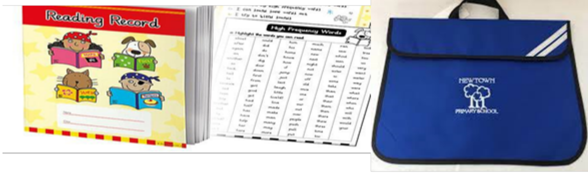
Şekil 3: İngiltere’de Okullarda Kullanılan Okuma Günlüğü ve Kitap Çantası

takip etmek; görüş ve yorumları kaydetmek için kullanılmaktadır. Kazanma hedefine yönelik kupa görseli ve “Ben harika bir okuyucuyum.” cümlesiyle süslenen 36 sayfadan oluşan bu okuma günlüklerinin son sayfaları, kitapta hoşlandıkları/hoşlanmadıkları bölümleri nedenleriyle yazmaları için ayrılmış, en sevdikleri bölümün aynen yazılması istenmiştir. Günlükte yüksek sıklıktaki kelimelerin listesi de verilmektedir.