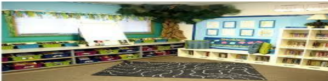
Şekil 2: İngiltere’deki Sınıf Kitaplığı Modeli

Okullarda yapılan bu toplantılarda üstün yetenekli, başarılı öğrenciler büyük edebî eserlerden seçtiklerini diğer öğrencilere tanıtmaktadır. Öğretmenler de kendi seçtikleri DEAR kitaplarından çıkardıkları özeti okur ve tartışırlar. Böylece öğrenciler giderek daha zor kitapları okumayı denemeye teşvik edilmektedir (United Kingdom Government, 2015).