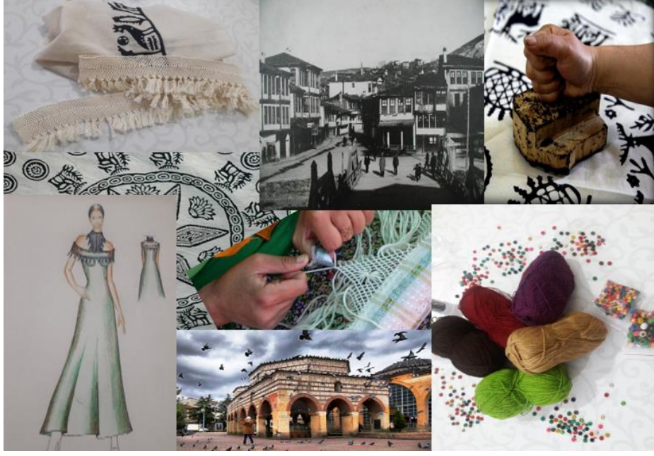
Fotoğraf 4: “Geleneksel El Sanatlarımız Özümüzdür” Temalı Hikâye Panosu