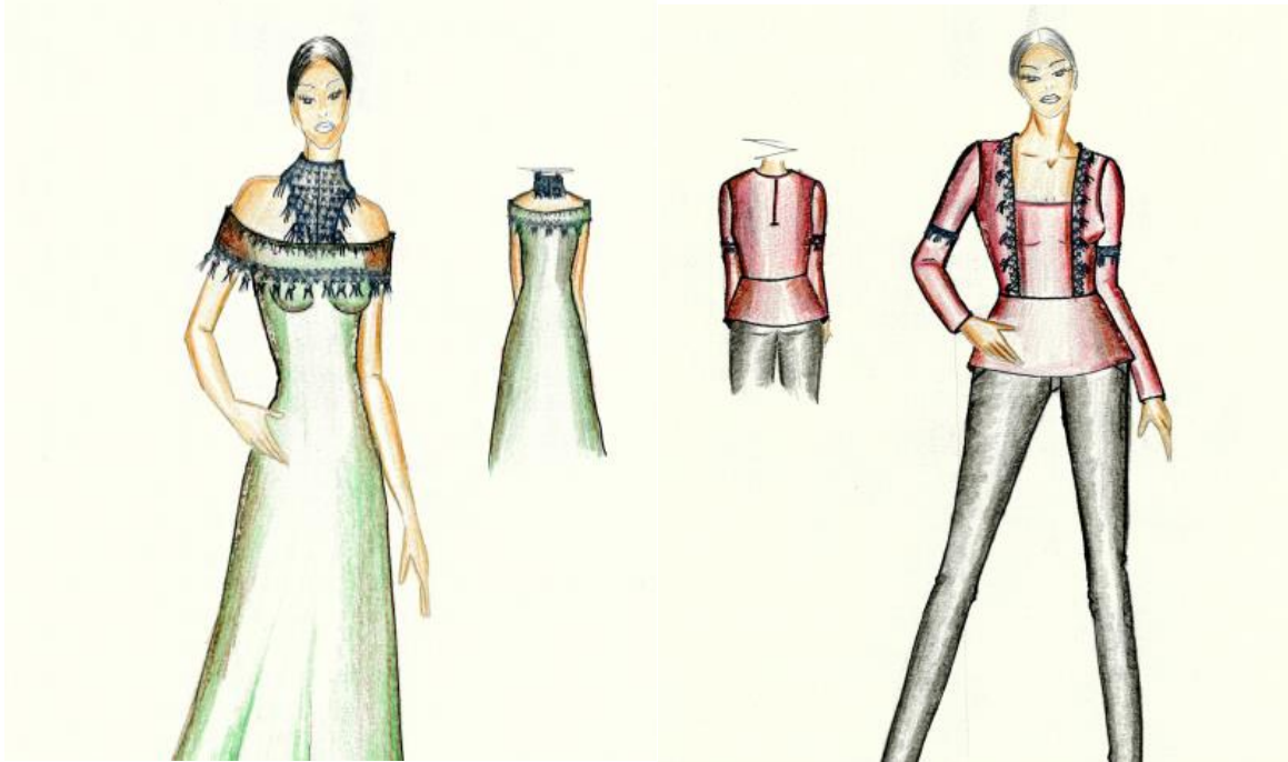
Çizim 1: Prototip Ürün Çizim Örnekleri

Prototipi yapılacak ürüne ait çeşitli tasarımlar yapılmıştır. Tasarımlar tema ve hikâye panosu göz önünde bulundurularak günümüz modasına uygun ve geleneksel dokunun en iyi şekilde yansıtılması planlanarak oluşturulmuştur.