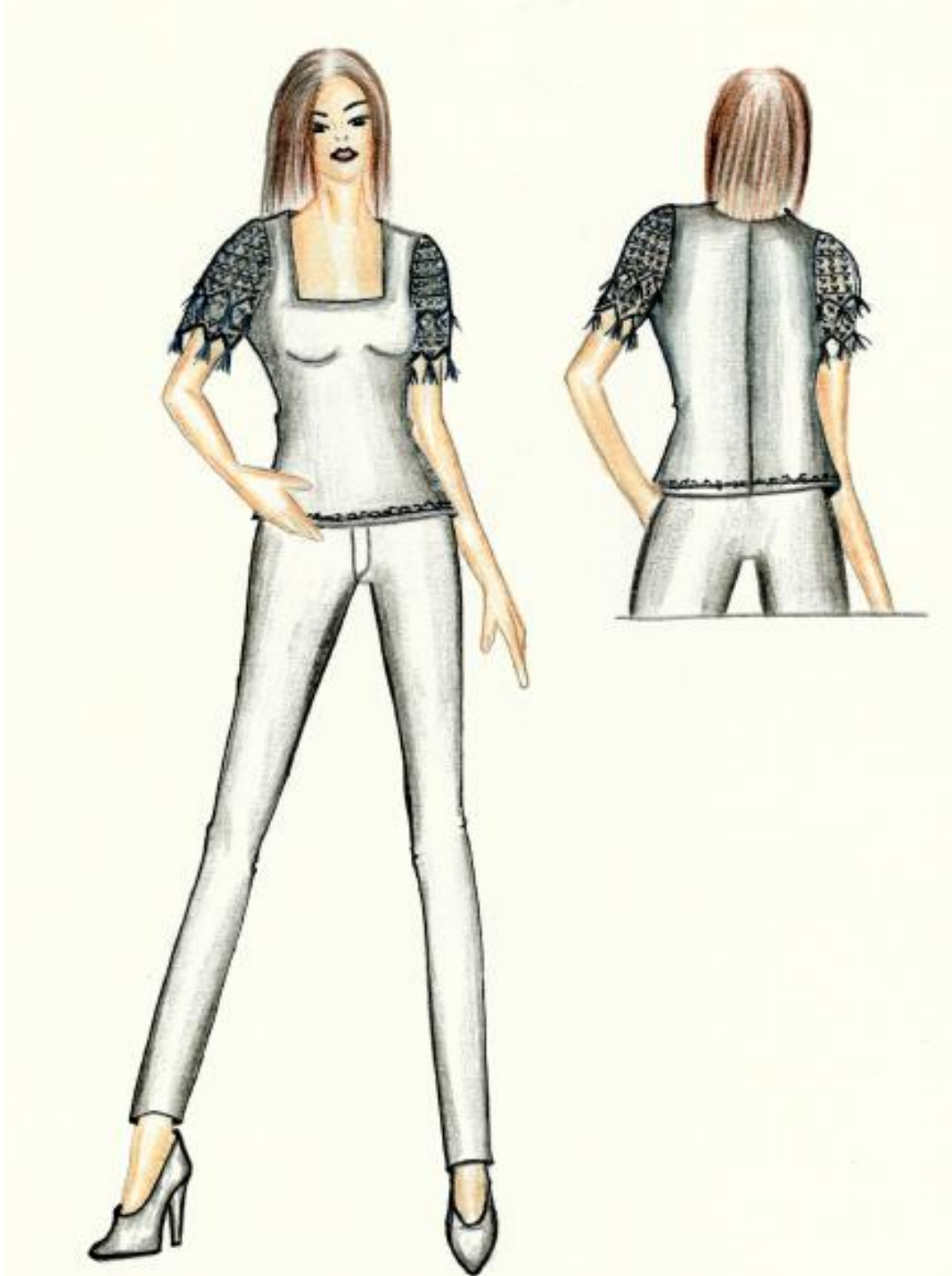
Çizim 3: Prototip ürün artistik çizimi

Prototip ürün için belirlenen tasarımın artistik ve teknik çizimi yapılarak kullanılan kumaşın ve dantelin dokusunu ve rengini yansıtacak biçimde renklendirilmesine dikkat edilmiştir.