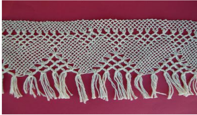
Fotoğraf 1: Kastamonu, Dantel Müzesinden Bağlama Örnekleri. (Yalçınkaya, 2009).

Çarşaf bağlamanın tarihi MÖ 7 ve 8. yüzyıl Hun Devletine dayanmaktadır. Kastamonu'da çarşaf bağcılığının tam olarak hangi tarihte başladığı bilinmemektedir. Ancak müzede ulaşılan eski çarşaf bağları 18. yüzyıla aittir. Çarşaf bağlarının dokumaların etrafını temizlemek ve süslemek için uzun bırakılan ipliklerin, alet kullanmadan düğümleyerek bağlanmasından ortaya çıktığı düşünülmektedir. Çarşaf bağlarının en eski örnekleri küçük parçalar halinde Kastamonu Müzesinde ayrıca Topkapı Sarayı Müzesinde, Ankara Etnografya Müzesinde de sergilenmektedir (Tan, 2007).