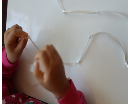
Şekil 4. Düğüm çözme etkinliği