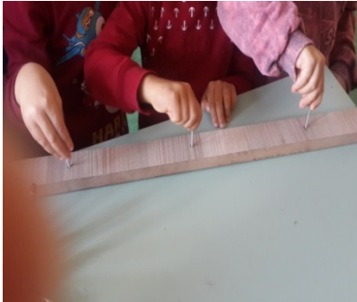
Şekil 3. Vida sökme takma