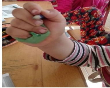
Şekil 2. Parmaklar arasına hamur koyma